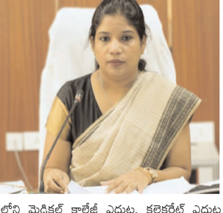
లోని మెడికల్ కాలేజీ ఎదుట, కలెక్టర్ డాక్టర్ ప్రియాంక అలా ఆదేశించారు.

జనసముద్రం మార్చి 19 జిల్లా స్టాఫ్ రిపోర్టర్ ఉమ్మడి ఖమ్మం. మెడికల్ కాలేజీలో విద్యార్థులు హాస్టల్లో కనీస సౌకర్యాల లేవని, హాస్టల్ ఫుడ్ నాణ్యత లేదని, త్రాగునీరు సక్రమంగా అందించడం లేదని, మెన్ చార్జీలు వసూలు చేస్తున్నారని, అధిక బండ్లు చార్జీలు వసూలు చేస్తున్నారని, ప్రిన్సిపల్, అసిస్టెంట్లు క్రమశిక్షణ నెపంతో రాత్తులు హాస్టల్ క్యాంపస్ లోకి ప్రవేశించి, వీడియోలు రికార్డ్ చేస్తూ బెదిరిస్తూ విద్యార్థులతో దురుసుగా ప్రవర్తిస్తున్నారని వారు క్రీడలు ఇతర సాంస్కృతిక కార్యక్రమాల్లో పాల్గొనడానికి కూడా అనుమతించడం లేదని భద్రాద్రి కొత్తగూడెం