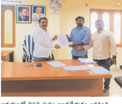
అధ్యక్షులలో వినతి వ్రతం అందజేయడం జరిగింది.

జనసముద్రం దేవరకొండ ప్రతినీధి మార్చి 19 దేవరకొండ నియోజకవర్గం, తెల్లపరపల్లి, చందంపేట మండలం లో బడికి పోని ఉపాధ్యాయులనూ సస్పెండ్ చేయాలని, దామరచర్ల మండలం, పెద్దతంద, ఇంద్రనగర్, పాఠశాల ఉపాధ్యాయులను సస్పెండ్ చేయాలని పిల్లలు లేకుండా ఉన్నట్లు చూపించి విద్యాశాఖాధికారులను తప్పుదోవ పట్టించిన ఉపాధ్యాయుల జాబితా రికవరి చేయించాలని తిమ్మాపురం పుట్టలగడ్డ సమయపాలన కాక ముందే పాఠశాల కు తాళ్ళం వేసిన ఉపాధ్యాయులను సస్పెండ్ చేయాలని ఆసుమతి లేకుండా 6రోజులు సెలవులు తీసుకున్న తిమ్మాపురం ప్రధానోపాధ్యాయులు వలు అంశాలపై నల్లగొండ జిల్లా డిఈఓ కి ఎస్ఎంఫెబి