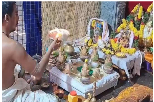
భృందం భక్తులు పాల్గొన్నారు.

యాదాద్రి భువనగిరి జిల్లా ఏప్రిల్: 20, భువనగిరి నియోజకవర్గ ప్రతినిధి: జనసముద్రం స్యూస్ యాదగిరిగుట్ట శ్రీమతి కొండపై శ్రీ వర్తక వర్షిని రామలింగేశ్వర స్వామి వారి ఆలయంలో నిర్వహిస్తున్న వసంత నవరాత్రి ఉత్సవాలు శుభవారంతో ముగిసాయి. సీతారామహనుమత్ మాలమంత్రజపము, దశకాంతి పంచనూక్త పారాయణలతో అభిషేకాలు చేసి రామాయణపారాయణం నిర్వహించారు. అష్టోత్తర శతనామార్చనలు నిర్వహించి శ్రీ సత్యనారాయణ స్వామి వ్రతాన్ని ఆచరించి ఉత్సవాలకు ముగింపు పలికారు. ఈ కార్యక్రమంలో ఆలయ అధికారులు ఆర్ధక