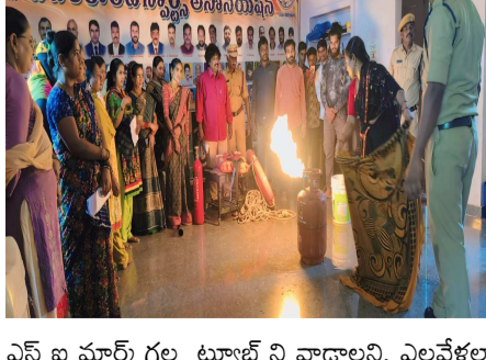
ఎన్ ఐ మార్చ్ గల టూల్స్ ని వాడాలని, ఎల్లవేళలా నీటిని మీ ఇంటిలో నిలువ ఉండేలా చూడండి. గ్యాస్ లీక్ అవుతున్నట్లు అనుమానం వస్తే వెంటనే రెగ్యులేటర్ వాల్యు ఆఫ్ చేయండి. అటువంటి సమయంలో ఎలక్షికల్ స్విచ్ ఆన్ ఆఫ్ చేయవద్దు, ఎల్వీజి వాడకం పూర్తయిన వెంటనే రెగ్యులేటర్

జన సముద్రం దేవరకొండ ప్రతినిధి ఏప్రిల్: 20 దేవరకొండ పట్టణంలో శనివారం రోజున స్ట్రీట్ అసోసియేషన్ ఆధ్వర్యంలో అగ్ని నివారణ అవగాహన కార్యక్రమం అధ్యక్షుడు యన్ విటి సభ్యులతో కలిసి కార్యక్రమాన్ని ప్రారంభించినారు. అగ్ని మాపక సిబ్బంది అగ్ని నివారణ చర్యల గురించి మహిళలకు వివరించడం జరిగినది , వారికి ప్రత్యేకంగా గ్యాస్ సిలిండర్లు తీరేస్తప్పుడు ఎలా ఆర్పాలి అనే దానిమీద వారితోనే సిలిండర్ అర్పించి చూపించినారు. అనంతరం అధ్యక్షుడు యన్ విటి మాట్లాడుతూ అగ్నిమాపక వారోత్సవాలలో భాగంగా నిర్వహిస్తున్నట్లు , కర్తవ్య నిర్వహణలో ప్రాణాలు కోల్పోయిన అగ్నిమాపక దళ సిబ్బందికి జోహార్లు అర్పించినారు. వంటగదిలో గాలి వెలుతురు బాగా ఉండేట్లు చూడాలని, ఐ