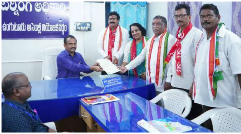
ఉంగుటూరు అసెంబ్లీ నియోజకవర్గం ఇండియన్ నేషనల్