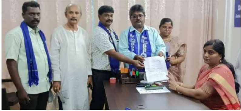
ఏలూరు జిల్లా దెందులూరు నియోజకవర్గం బీఎస్పీ ఎంఎల్ఏ