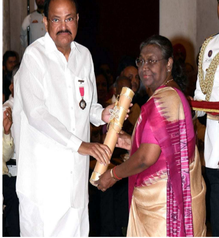
భారత మాజీ ఉపరాష్ట్రపతి వెంకయ్య నాయుడు. ఈ కార్యక్రమంలో ప్రధాని నరేంద్రమోడీతో పాటు పలువురు కేంద్ర మంత్రులు పాల్గొన్నారు.

జనసముద్రం న్యూస్ ఏప్రిల్ 23: ధీర్జీ వేదికగా రాష్ట్రపతి ద్రౌపదీ ముర్ము చేతుల మీదుగా పద్మవిభూషణ్ అవార్డు అందుకున్నారు.. భారత మాజీ ఉపరాష్ట్రపతి వెంకయ్య నాయుడు. ఈ కార్యక్రమంలో ప్రధాని నరేంద్రమోడీతో పాటు పలువురు కేంద్ర మంత్రులు పాల్గొన్నారు.