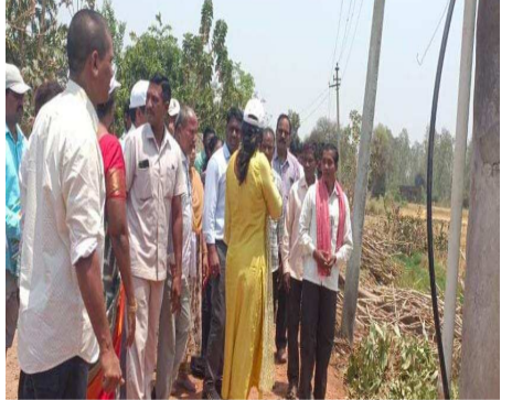
నగర్, సుందరయ్య నగర్ గ్రామాల్లో పర్యటించి గ్రామస్థులను అడిగి వివరాలు తెలుసుకున్నారు. 23 గ్రామ పంచాయతీల పరిధిలో తాగునీటి ఇబ్బందులు లేకుండా చూడాలని ఆదేశించారు. అనంతరం బయ్యారం ట్రాన్ రోడ్ లో డ్రైనేజీ కొలతకు మించి నిర్మాణాలు చేపట్టారని ఫిర్యాదులు