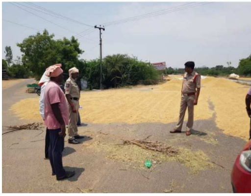
తగు విధంగా వ్యవహరించి సహకరించాలని, ఎవరికీ ప్రాణ నష్టం జరిగిన రైతులే బాధ్యులవుతారు. రైతులు ఎవరు గాని కేసుల పాలు కావద్దని సూచించారు.