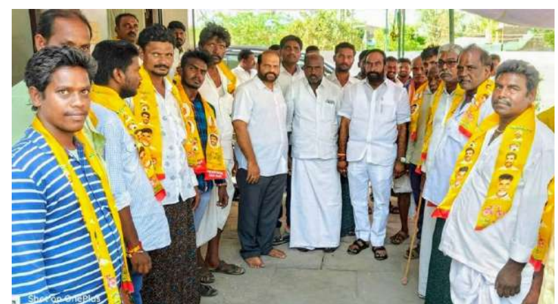
జనసముద్రంన్యూస్ , ఏట్రిల్ 26, పల్నాడు జిల్లా, మాచర్ల నియోజకవర్గం, వెల్దర్తి మండలం. వెల్దర్తి మండలంలోని పట్లవీడు , శివలింగాపురం గ్రామాలకు చెందిన 50 కుటుంబాల వారు వైఎస్సార్ కాంగ్రెస్ పార్టీని వీడి తెలుగుదేశం పార్టీ తీర్థం పుచ్చుకొని పార్టీ