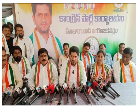
తెలిపారు. పదేళ్లు అధికారంలో ఉండి మీరు చేయలేకపోయారు, అధికారంలోకి వచ్చిన 6 నెలల్లోనే చేసి చూపిస్తామని తెలిపారు.

జనసముద్రం న్యూస్ ఏప్రిల్ 27 30 వ తారీఖున జమ్మికుంట కాలేజీ గ్రౌండ్ లో కరీంనగర్ పార్లమెంట్ పరిధిలో తొలి భారీ బహిరంగ సభ హుజూరాబాద్ కాంగ్రెస్ పార్టీ ఇంచార్జ్ వోడితల ప్రణవ్ మీడియా సమావేశం ముఖ్యమంత్రి హెరాదాలో తొలిసారి హుజూరాబాద్ కు రానున్న రేవంత్ రెడ్డి, ఈ ఎన్నికలు ధర్మానికి అధిస్థానికి మధ్య జరుగుతున్న ఎన్నికలు. గ్రామ గ్రామాన, వాడ వాడలా ఇందిరమ్మ ఇళ్లు ఉన్నాయా, కేంద్రం కట్టించిన డబుల్ బెడ్ రూం ఉన్నాయా అని చూడండి. హుజూరాబాద్ కాంగ్రెస్ పార్టీ కార్యాలయంలో కాంగ్రెస్ పార్టీ ఇంచార్జ్ వోడితల ప్రణవ్ విలేజరులకు సమావేశం నిర్వహించారు.