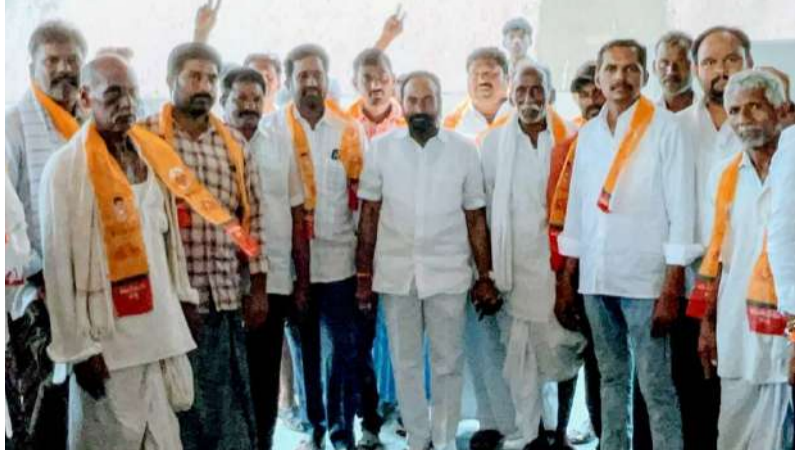
జనసముద్రం న్యూస్, ఏప్రిల్ 30, పల్నాడు జిల్లా, మాచర్ల నియోజకవర్గం, వెల్దుర్తి మండలం. అన్నదాతలకు సహాయం పేరిట ఏడాదికి 20వేల రూపాయలు ఎన్టీపీ ప్రభుత్వం సహాయం చేయడం జరుగుతుందని మాచర్ల నియోజకవర్గం ఎన్టీపీ కూటమి అభ్యర్థి