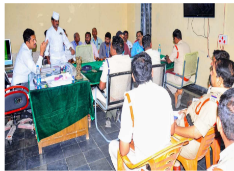
ఎన్నికల ప్రవర్తన నియమావళి ఉల్లంఘన పై కేసులు నమోదు అంశాలపై క్షేత్రస్థాయి సమీక్ష