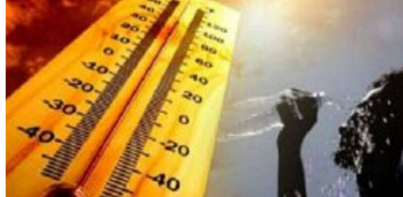
జారోందే, ఒడిశాలోని కొన్ని ప్రాంతాల్లో వేడిగాలులు వీచే అవకాశం ఉంది. దీంతో పాటు కార్పాటక్, తెలంగాణ, ఆంధ్రప్రదేశ్ లోని కొన్ని ప్రాంతాల్లో తీవ్ర వేడిగాలులు వీచే అవకాశం ఉంది. ఉష్ణోగ్రతల నుంచి మిమ్మల్ని మీరు రక్షించుకోవడానికి తీసుకోవాల్సిన చర్యలు: ఇంట్లోనే ఉండండి, కిటికీలు, తలుపులు మూసి ఉంచండి. వీలైనంత వరకు ప్రయాణం మానుకోండి. కాంక్రీట్ నేలపై పడుకోవద్దు, కాంక్రీట్ గోడలకు అనుకుని కుర్చుకోవద్దు. ఎలక్ట్రానిక్ పరికరాలను అన్ప్లగ్ చేసి ఉంచండి ఎండల వేడి నేపథ్యంలో పశ్చిమ బెంగాల్, ఒడిశా, బీహార్, రాయలసీమ వంటి ప్రాంతాల్లో హీట్ స్ట్రోక్ ప్రమాదం కలగనుందని రెడ్ అలర్ట్ ను వాతావరణ శాఖ జరి చేసింది, హిమాలయ పర్వత ప్రాంతాలు, పశ్చిమ బెంగాల్, సిక్కిం, తెలంగాణ, కర్ణాటక వంటి ప్రాంతాలకు ఆరెంజ్ అలర్ట్ ను జారీ చేశారు.

ఏప్రిల్, మే నెలలకు సంబంధించి ఈ రెండు నెలలు ఇతర సంవత్సరాల కంటే అత్యధిక ఉష్ణోగ్రతలు ఉండవచ్చని వాతావరణ శాఖ గతంలో కూడా చెప్పింది. వాతావరణ శాఖ అధికారులు ఈ సందర్భంగా ప్రజలు ప్రత్యేక శ్రద్ధ వహించాలని విజ్ఞప్తి చేశారు. ఏడాది ఏడాదికి ఎండ వేడిమి, వేడి గాలులు తీవ్రత పెరిగిపోతోంది. ఉత్పాదక శక్తి జనం అల్లాడిపోతున్నారు. ఒకలాంటి విచిత్ర వాతావరణం ఏప్రిల్ నెలలో కనిపించింది. ఈ నెలలో రికార్డ్ స్థాయిలో ఉష్ణోగ్రతలు నమోదయ్యాయి. 103 సంవత్సరాల తర్వాత అన్ని రికార్డులను బద్దలు కొట్టింది. చాలా చోట్ల ఉష్ణోగ్రత వేడి 43 డిగ్రీలకు చేరుకుంది. అంతేకాదు తాజాగా మే నెలలో వాతావరణం ఎలా ఉంటుందో వాతావరణ శాఖ సమాచారం ఇచ్చింది. వాతావరణ శాఖ ఏప్రిల్ నెలలో 1921-2024 మధ్యకాలంలో ఉష్ణోగ్రతలు ఉన్న డేటాను పంచుకుంది. దేశంలోని అనేక ప్రాంతాల్లో ఏప్రిల్ నెల అత్యంత వేడి నెలగా ఉన్నదని ఈ డేటా చూపుతోంది. ఇక మరో ఐదు రోజుల్లో ఇది మరింత వేడిగా మారుతుంది. %౪౫% ప్రకారం దేశంలోని తూర్పు, దక్షిణ ద్వీపకల్పంలో తీవ్రమైన వేడిగాలుల ప్రభావం కనిపిస్తోంది. మరో ఐదు రోజుల్లో విపరీతమైన వేడి.. ఈ తీవ్రమైన ఉష్ణోగ్రతలు, వడగాలులు రాబోయే ఐదు రోజుల పాటు కొనసాగునున్నాయి. ఇక్కడ గమనించాల్సిన విషయం ఏంటంటే.. ఈ సమయంలో ఓటింగ్ జరగాల్సిన చోట్ల వేడి ఎక్కువగా ఉంటుంది. బెంగాల్, బీహార్,