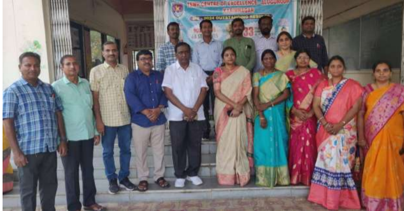
తర్వాత మంచి మిత్రులతో స్నేహం చేయవలెనని సూచించారు. విద్యార్థులు నిరాశ నిస్సహాయులకు గురికావద్దని, వారు వారికి నచ్చిన కోర్సులలో జాయిన్ అయి వారియొక్క ప్రతిభను నిరూపించుకోవలసిన సూచించారు. పదవతరగతిలో 100 శాతం ఫలితాలు సాధించినందులకు 20మంది విద్యార్థులు 10/10 % గా సాధించినందులకు గాను విద్యార్థులను మరియు ప్రధానాచార్యులను పాఠశాల సిబ్బందిని అభినందించినారు.