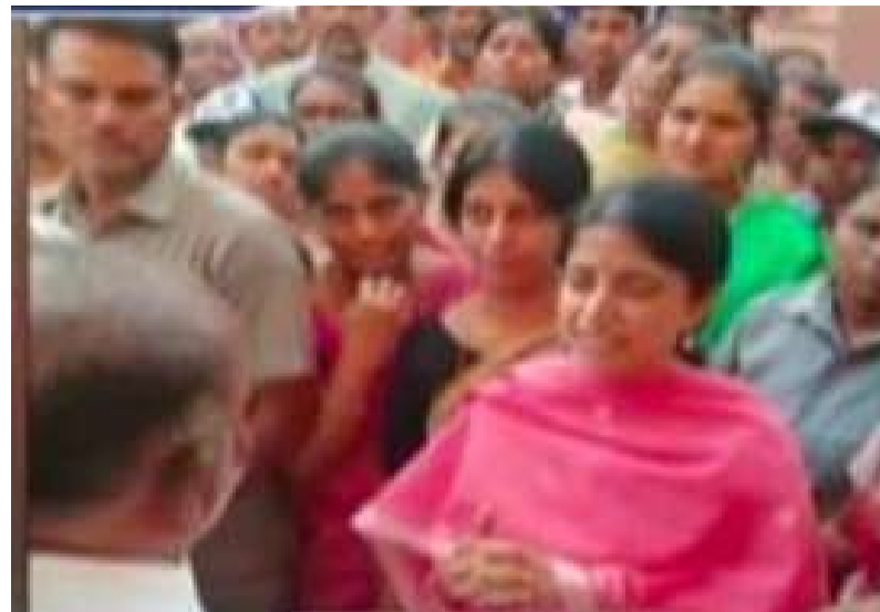
"కుమ్మరపల్లి నుంచి" వెన్నుతిరిగి వెళ్ళిపోవడం జరిగినది, ఈ విషయం జరిగిన తరువాత పులివెందుల నియోజకవర్గంలో పెద్ద హార్ట్ టాపిక్ గా జనాలు చెప్పుకుంటున్నారని విశ్లేషకులు చెప్పుకొచ్చారు, ఈ విషయమై కొన్ని చానల్స్ లో కూడా రావడం జనాలు గుసగుసలు పడటం చర్చనీయమైనది, తన సొంత ఊరికైనా పులివెందుల ప్రజలకి న్యాయం చేయలేని వాడు.. రాష్ట్రానికి ఏం న్యాయం చేస్తాడు..! అంటూ జనాలు గుసగుసలు పడటం గమనార్హం.