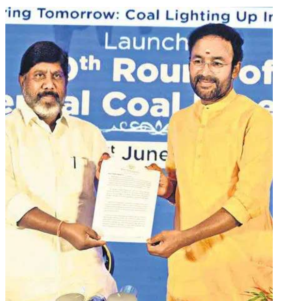
కార్యక్రమంలో పాల్గొన్న భట్టి ఆయనతో మాట్లాడారు. ప్రధాని అపాయింట్మెంట్ తీసుకోండి... సింగరేణి ప్రాంతంలోని గనులను సంస్థకే కేటాయించేలా ప్రధాని మోడీతో మాట్లాడి ఒప్పించాలని కేంద్ర మంత్రి కిషన్ రెడ్డికి భట్టి విక్రమార్కు విజ్ఞప్తి చేశారు. ఈ విషయంలో చొరవ చూపి ప్రధాని అపాయింట్మెంట్ తీసుకుంటే సీఎం రేవంత్ రెడ్డి, తాను, ఇతర పార్టీల నేతలతో కలిసి అభిలషక్తంగా ఆయన్ను కలిసి విజ్ఞప్తి చేస్తామన్నారు.

గనుల మాతతో 15 ఏళ్లలో సంస్థ మాతాబడే స్థాయికి పడిపోతుంది ఇప్పటికే ప్రైవేటు చేతుల్లోకి వెళ్లిన రెండు గనులను తిరిగి సింగరేణికి ఇవ్వాలి సింగరేణి ప్రాంతంలోని అన్ని గనులను సంస్థకే కేటాయించేందుకు ప్రధానిని ఒప్పించండి కేంద్ర బొగ్గు గనుల శాఖ మంత్రి కిషన్ రెడ్డిని కోరిన డిప్యూటీ సీఎం భట్టి విక్రమార్కు