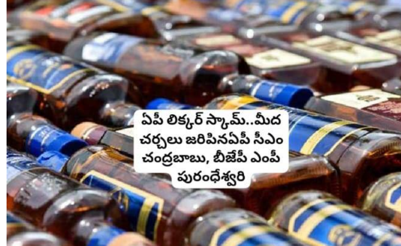
ఏపీ లిక్కర్ స్కామ్..మీద చర్చలు జరిపినఏపీ సీఎం చంద్రబాబు, బీజేపీ ఎంపీ మురంధేశ్వరి