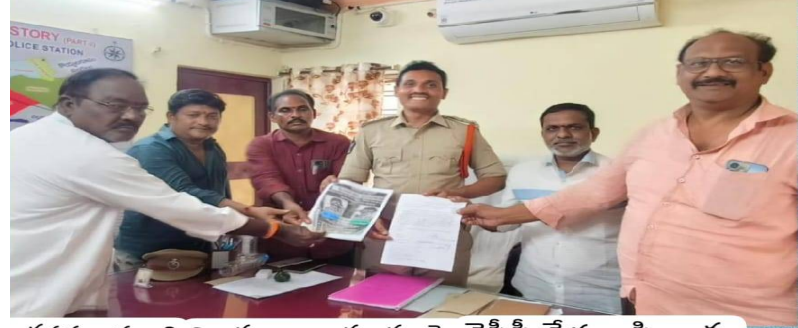
జగనన్న, తలారి శిలాఫలకాలు ధ్వంసం పై వైసీపీ నేతలు ఫిర్యాదు