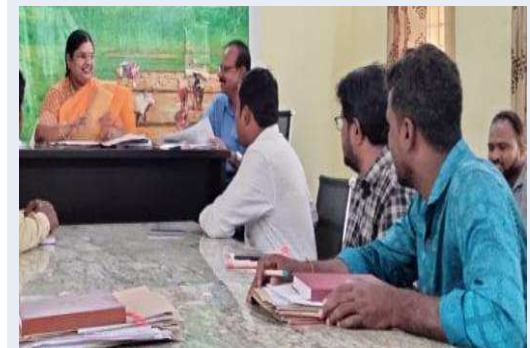
మెదక్ జిల్లా చిన్న శంకరంపేట్ జనసముద్రం స్యూస్ జూలై 3 ధరణిలోని సమస్యలను వెంటనే పరిష్కరించాలని మెదక్

ఆర్డీ. రమాదేవి ఎమ్మెల్యే మాన్యూన్ కు సూచించారు. బుధవారం చిన్న శంకరంపేట్ లోని ఎమ్మెల్యే కార్యాలయాన్ని ఆమె పరిశీలించి రికార్డులను తనిఖీ చేసి అధికారులకు పలు సూచనలు చేశారు. విద్యార్థులకు కుల ఆదాయ సర్టిఫికెట్లను త్వరితగతిన అందించాలని అన్నారు. ధరణిపై వచ్చిన ఫిర్యాదులను వెంటనే పరిష్కరించాలన్నారు. కళ్యాణ లక్ష్మి, షాద్ ముబారక్ కోసం దరఖాస్తు చేసుకున్న లబ్ధిదారుల దరఖాస్తులను పరిశీలించి త్వరగా మంజూరు చేయించేలా చర్యలు తీసుకోవాలని తెలిపారు. కార్యాలయంలో రైతులకు సౌకర్యాలు కల్పించాలన్నారు. కార్యక్రమంలో డిప్యూటీ డిప్యూటీ ఎమ్మెల్యే మహేందర్ గౌడ్, ఆరం చంద్రశేఖర్ పాల్గొన్నారు.