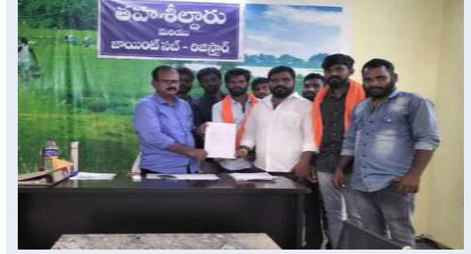
మెదక్ జిల్లా చిన్న శంకరంపేట్ జనసముద్రం స్యూస్ జూలై 3 కాంగ్రెస్ ప్రభుత్వం నిరుద్యోగ భృతి కల్పిస్తానని చెప్పి