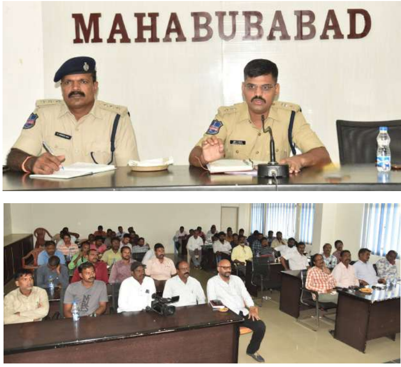
మీడియా మరియు పోలీస్ శాఖ సమన్వయం తో పని చేయాలి.