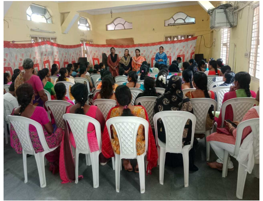
జనసముద్రం : జూలై 16 ( పెద్దపల్లి జిల్లా ఇంచార్జ్ ) పెద్దపల్లి జిల్లా కేంద్రంలోని మున్సిపల్ కార్యాలయంలో మంగళవారం రోజు ఏర్పాటు చేసిన మహిళా శక్తి కేంద్రం సమావేశంలో పెద్దపల్లి జిల్లా మహిళా సాధికారి కేంద్రం