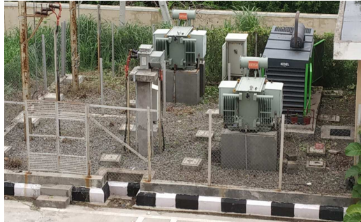
రోజు జనసముద్రం పత్రికలో వచ్చిన వార్తా కథనానికి స్పందించడంతో సమీకృత కలెక్టరేట్ కార్యాలయం ఆవరణలోని ట్రాన్స్ఫార్మర్ జనరేటర్ (ఎలక్ట్రిసిటీ యాడ్) లో సోమవారం రోజు గడ్డిని, చెట్లను, పొదలను పూర్తిగా తొలగించారు.

జనసముద్రం : జూలై 16 ( పెద్దపల్లి జిల్లా ఇంచార్జ్ ) పెద్దపల్లి జిల్లా సమీకృత కలెక్టరేట్ కార్యాలయం ఆవరణలోని జనరేటర్ ట్రాన్స్ఫార్మర్ లోని విచ్చలవిడిగా పెరిగిన గడ్డి, చెట్టు పొదల కారణంగా ( ఎలక్ట్రిసిటీ యాడ్ ) ఉన్న ప్రదేశంలో విపరీతంగా చెట్టు గడ్డి పొదలు పెరగడంతో సీనియర్ ఇంజనీరుల సహకారంతో చక్కాకలం కావడంతో ఆ ప్రదేశంలో షార్ట్ సర్క్యూట్ , జనరేటర్ కాలిపోయే ప్రమాదం , ఐ డి ఓ ఎస్ బిల్డింగ్ కావడంతో అందరే గ్రౌండ్ హెంబీ కేబుల్ పాడైపోయే ప్రమాదం ఉందని, జనరేటర్ ఆవరేటర్ విద్యుత్ శాఖ అధికారులు ట్రాన్స్ఫార్మర్ జనరేటర్ దగ్గరికి వెళ్లి అందులో తిరుగుతూ ఎలా పనిచేస్తారని వాళ్లకు షార్ట్ సర్క్యూట్ జరిగితే బాధ్యులు ఎవరని ? తేది : 13 జూలై 2024 శనివారం