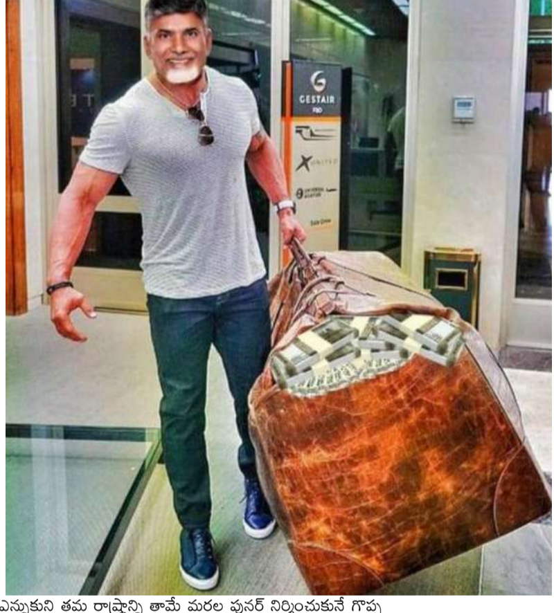
ఎన్నుకుని తమ రాష్ట్రాన్ని తామే మరల పునర్ నిర్మించుకునే గొప్ప