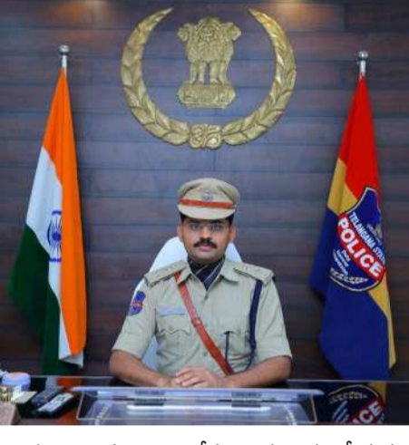
మొత్తం 05 మంది పై కేసులు నమోదు చేయడం జరిగిందన్నారు.