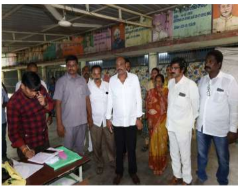
పాఠశాలను సందర్శించి విద్యార్థుల సామర్థాలను