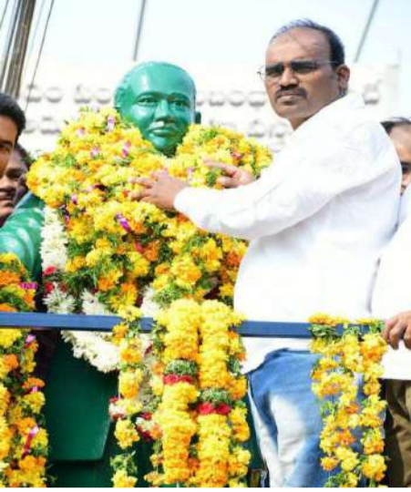
సోదరుల సుదీర్ఘ పోరాట ఫలితం ఈ రోజు