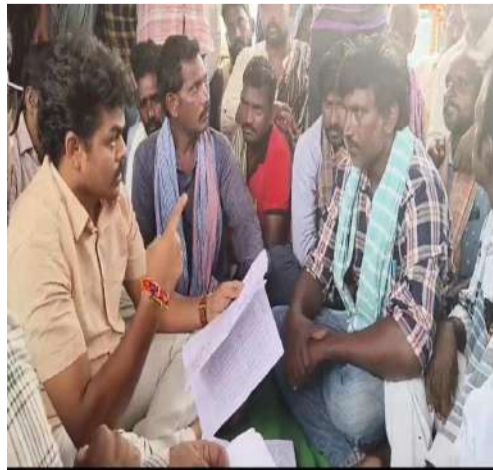
విరామింపచేసి వారికి జ్ఞాన్ త్రాగించారు, ఈ కార్యక్రమంలో తెలుగుదేశం-జనసేన-బిజెపి పార్టీ నాయకులు కార్యకర్తలు శ్రేణులు పాల్గొన్నారు.