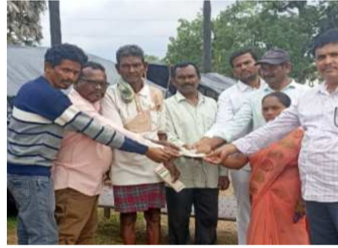
సర్పంచ్ ఆధ్వర్యంలో ప్రజలకి ఇవ్వడం జరిగింది.

జనసముద్రం స్టూన్ 02 ఆగస్టు : చీట్టి గ్రామపంచాయతీలో వరదల కారణంగా వరదల విపత్తు కారణంగా ప్రతి ఇంటికి 3000/- రూపాయలు చొప్పున గ్రామ సర్పంచి మరియు ఎన్ డి ఏ ప్రభుత్వ నాయకుల సమక్షంలో ఇచ్చారు. ఎన్ డి ఏ ప్రభుత్వం వరదల క్రింద ప్రతి ఇంటికి 3000/- రూపాయలు చొప్పున అలాగే ప్రతి కుటుంబానికి 25 కేజీలు బియ్యము, మంచి నూనె, కందిపప్పు, బంగాళదుంపలు, అరటికాయలు, ఉల్లిపాయలు వరద బాధితులకి విపత్తు క్రింద ఎన్ డి ఏ ప్రభుత్వము ఎన్డీపీ నాయకులు ద్వారా అలాగే గ్రామ