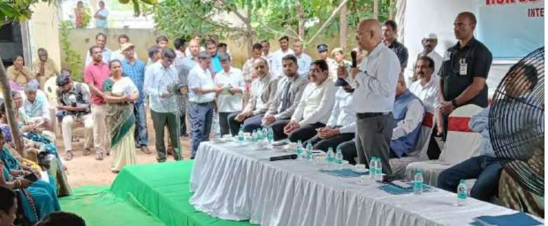
సంఘం హెల్త్ సెక్టార్ నిధులను సక్రమంగా ఉపయోగించుకున్నారని, అదేవిధంగా నాణ్యమైన విద్య కోసం అదనపు తరగతి గదులు నిర్మించి ఈ గ్రామం అభివృద్ధి పట్ల సంతోషం వ్యక్తం చేయడం జరిగింది.

జన సముద్రం జిల్లా ప్రతినిధి: యాదాద్రి జిల్లా భువనగిరి మండలం అసంతారం గ్రామపంచాయతీకి 16 ఆర్థిక సంఘం కమిషన్ సభ్యులు మరియు రాష్ట్రస్థాయి అధికారులు జిల్లా అధికారులు 15వ ఆర్థిక సంఘం నిధుల ద్వారా అసంతారం గ్రామంలో అభివృద్ధి చేసినటువంటి ప్రాథమిక ఆరోగ్య ఉపకేంద్రం పల్లె దావఖానా పనులు అదేవిధంగా మండల పరిషత్ 15 ఆర్థిక సంఘం నిధుల ద్వారా నిర్మించిన ప్రాథమిక పాఠశాల అదనపు తరగతి గదులు పరిశీలించడం జరిగింది మరియు 15 ఆర్థిక సంఘం నిధులు గ్రామానికి ఏకంగా ఉపయోగపడినవి చేపట్టిన కార్యక్రమాల గురించి మాజీ ప్రజాప్రతినిధులు, మహిళా సంఘం సభ్యులతో మరియు గ్రామస్థులతో ముఖాముఖి చర్చించారు. మరియు గ్రామ పంచాయతీకి సంబంధించి అడిటు అభ్యంతరాలు అడిట్ రిపోర్టు మరియు గత బదు సవత్సరాల్లో వచ్చినటువంటి గ్రామపంచాయతీకి వచ్చిన 15 ఆర్థిక సంఘం నిధులు వాటి యొక్క ఖర్చుల వివరాలు మండల పరిషత్ కు వచ్చినటువంటి నిధులు మరియు వాటి ఖర్చుల వివరాలను ప్రార్తిస్థాయిలో పరిశీలించడం జరిగింది. 15వ ఆర్థిక సంఘం నిధుల ఉపయోగించుకొని చేసినటువంటి ప్రాథమిక ఆరోగ్య ఉపకేంద్రం పల్లె దవఖాన 15 ఆర్థిక