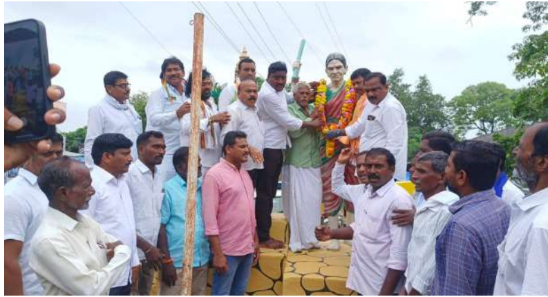
చాకలి ఐలమ్మ పోరాల సూర్పాని ప్రతి ఒక్కరు కలిగి ఉండాలి.