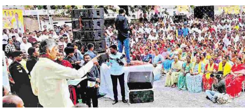
వరదల నేపథ్యంలో రాష్ట్ర ప్రభుత్వం చేపట్టిన తక్షణ సహాయక చర్యల స్వీయ పర్యవేక్షణలో ఉన్న సీఎం చంద్రబాబు.. రెండు వారాలుగా పార్టీ కార్యాలయానికి రాలేకపోయారు.

అమరావతి, సెప్టెంబరు 20 : ముఖ్యమంత్రి చంద్రబాబు నాయుడు శనివారం ఇక్కడి తెలుగుదేశం పార్టీ కేంద్ర కార్యాలయానికి రానున్నారు. ఉదయం 11 గంటలకు ఆయన వస్తారని టీడీపీ కార్యాలయ వర్గాలు తెలిపాయి. సందర్భులను కలవడంతోపాటు అందుబాటులో ఉన్న పార్టీ నేతలతో ఆయన సమావేశం అవుతారని పేర్కొన్నాయి. విజయవాడ