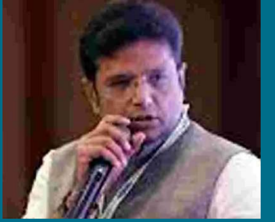
(మిగతా 2వ పేజీలో)

సీమీ కండక్టర్ల రంగంలో ఉపాధి అవకాశాలు నైపుణ్యతతో అందిపుచ్చుకోవాలి: శ్రీధర్ బాబు