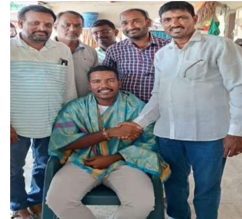
నాయకులు కుడికాల సాయి, మరియు రాంపూర్ పద్మశాలి కుల బాంధవులు అధిక సంఖ్యలో పాల్గొన్నారు