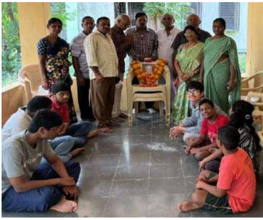
ఈ కార్యక్రమంలో భవిత సెంటర్ అధ్యక్షులు కొండ్రె వెల్ఫేర్ అసోసియేషన్ సభ్యులు తదితరులు పాల్గొన్నారు