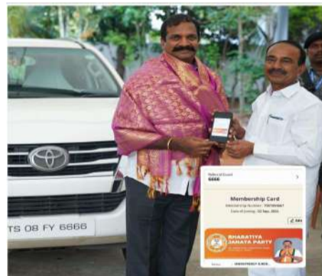
పాలుపంచుకోవడం సంకేషంగా వుందని అన్నారు.