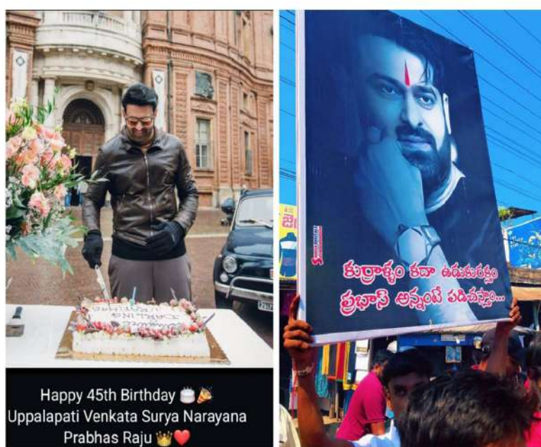
Happy 45th Birthday Uppalapati Venkata Surya Narayana Prabhas Raju