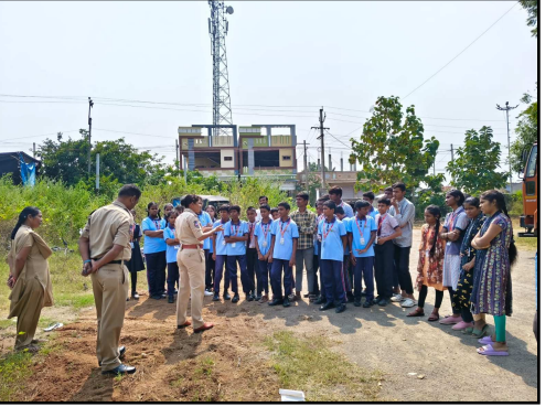
చౌప్పందం (జనసముద్రం న్యూస్): పోలీస్ అమరవీరుల వారోత్సవాల సందర్భంగా పోలీస్ స్టేషన్లో ఓపెన్ హౌస్ అనే కార్యక్రమం నిర్వహించబడింది