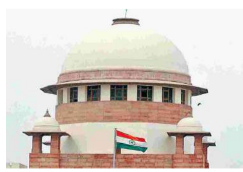
(మిగతా 2వ పేజీలో)

న్యూఢిల్లీ, అక్టోబరు 24: ఆస్తుల కూల్చి వేతల కారణంగా నష్టపోయిన బాధితులు న్యాయస్థానాలను ఆశ్రయించవచ్చని గురువారం సుప్రీంకోర్టు తెలిపింది. న్యాయ స్థానం ఆదేశాలను కాదని ఆస్తులను కూల్చి వేసిన రాష్ట్ర ప్రభుత్వాలపై కోర్టు ధిక్కరణ చర్యలు చేపట్టడానికి మాత్రం నిరాకరించింది. సుప్రీంకోర్టు అనుమతి లేకుండా