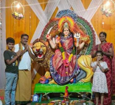
విగ్రహమూడి (జనసముద్రం స్టాన్ ప్రతినిధి): కరీంనగర్ జిల్లా విగ్రహమూడి మండలం సుందరగిరి గ్రామంలోని ఎక్స్ రోడ్ వద్ద దుర్గామాత ఉత్సవ కమిటీ