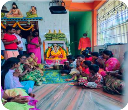
దర్శనమిస్తారని ఆయన తెలియజేశారు ఈ కార్యక్రమంలో భారీ సంఖ్యలో భక్తులు పాల్గొనడం జరిగింది