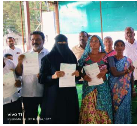
మహాబాబాబాద్ జిల్లా ప్రతినిధి జనసముద్రం న్యూస్ అక్టోబర్ 8 మహాబాబాబాద్ పట్టణ కేంద్రంలోని ఎమ్మెల్యే క్యాంపుకార్యాలయంలో నెల్లికుడు, గూడూర్, కేసముద్రం, మహాబాబాబాద్ మండలాల సీఎంఆర్ఎఫ్

500 మంది రూపాయలు కేసముద్రం మండలానికి 16 చెక్కులకు గాను 12 లక్షల, 3500 వేల రూపాయలు, గూడూరు మండలానికి 9 చెక్కులకు గాను 2 లక్షల 31,000 వేల రూపాయలు, మహాబాబాబాద్ మండలానికి గాను 26 చెక్కులకు 84 లక్షల 7000 వేల రూపాయలు, నెల్లికుడు మండలానికి 23 చెక్కులకు గాను 6 లక్షల 43000 వేల రూపాయలు కాంగ్రెస్ ప్రభుత్వం ఇప్పించినారని అలాగే హాస్పిటల్లో ఖర్చులో నిమిత్తం నిరుపేద కాంగ్రెస్ పెద్ద ఎత్తున అందగా నిలుస్తుంది అన్నారు. కార్యక్రమంలో పట్టణ అధ్యక్షులు మహాబాబాబాద్ నియోజకవర్గ 4 మండలాల అధ్యక్షులు జిల్లా డీసీసీ ఉపాధ్యక్షులు జిల్లా కాంగ్రెస్ పార్టీ సీనియర్ నాయకులు మాజీ ఎంపీటీసీలు సర్పంచులు ఎంపీటీసీలు పట్టణ పలు వాటిలో కౌన్సిల్లర్లు చెక్కుల లబ్ధిదారులు కాంగ్రెస్ పార్టీ కార్యకర్తలు పార్టీ శ్రేణులు తదితరులు పాల్గొన్నారు