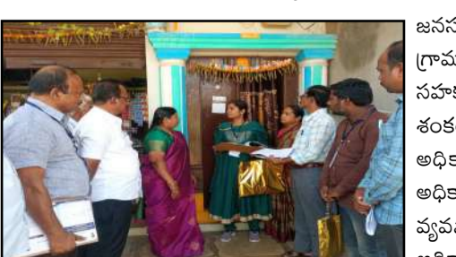
కోరారు. అలాగే చందంపేటలో డిఎల్విడీ సురేష్ బాబు సర్వేను పరిశీలించి అధికారులకు పలు సూచనలు చేశారు. ఎమ్మార్వో మన్నన్, ఎంపీడీవో దామోదర్ లు పాల్గొన్నారు.

జనసముద్రం న్యూస్, చిన్న శంకరంపేట్ మండలం, మెడక జిల్లా: గ్రామాలలో చేపడుతున్న కుల గణన సర్వేకు ప్రతి ఒక్కరు సహకరించాలని ఆర్డివో రమాదేవి సూచించారు. బుధవారం చిన్న శంకరంపేట పట్టణంలో కులగణన సర్వేను ఆమె పరిశీలించి అధికారులకు పలు సూచనలు చేశారు. సర్వేకు వచ్చిన అధికారులకు ఇంటి యజమాని అధికారి కార్డు, రేషన్ కార్డు, వ్యవసాయ పొలాల వివరాలను అందించాలన్నారు. అధికారులెవరు ఫోటోలు తీసుకోరని, సర్వేకు సహకరించాలని