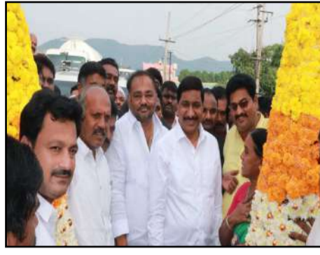
పలు విషయాలను చర్చిస్తూ,పలు సమస్యలపై ఆయన విన్నవించారు. ఈ కార్యక్రమంలో ప్రభుత్వాధికారులు,తెలుగుదేశం పార్టీ ముఖ్య నాయకులు కార్యకర్తలు,అభిమానులు పెద్ద ఎత్తున పాల్గొన్నారు.