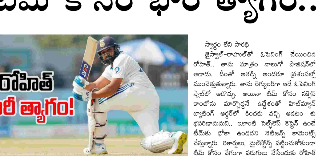
టీమ్ కోసం ఓపెనింగ్ పాజిషన్ త్యాగం చేశాడు రోహిత్. పెర్ల డెన్స్ లో తన స్థానంలో ఇన్నింగ్స్ స్ట్రాక్ చేసిన కేవల్ రామోలితు అతడు అందగా నిలిచాడు. ప్రైమ్ మినిస్టర్స్ ఎలెక్షన్ లో జరుగుతున్న వార్షిక్ మ్యాచ్ లో యంగ్ ఓపెనర్ యువ్వు జైస్వల్ తో జతగా రామోలితు ఓపెనింగ్ కు పంపాడు హిట్మ్యాన్. కొడుకు పట్టుడంతో ఆస్ట్రేలియాతో జరిగిన తొలి డెన్స్ లో రోహిత్ దూరమైన సంగతి తెలిసిందే. దీంతో అతడి స్థానంలో రాహుల్ ఆ మ్యాచ్ లో ఇన్నింగ్స్ ను మొదలుపెట్టి సక్సెస్ అయ్యాడు. సెకండ్ ఇన్నింగ్స్ లో జైస్వల్ తో కలసి తొలి వికెట్ కు