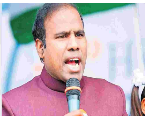
కేవీ పాల్ సంచలన వ్యాఖ్యలు చేశారు. దాంతో తన సత్యా ఏంటో మాజీ సీఎం జగన్, ప్రధాని మోడీకి తెలిసిందని వివరించారు. విశాఖ స్టీల్ ప్లాంట్ ప్రైవేటీకరణ గురించి ఆంధ్రప్రదేశ్ హైకోర్టులో లాయర్

ప్రశ్నించారు. ప్రత్యేక హోదా వస్తే రాష్ట్రం ఎంతో అభివృద్ధి చెందుతుందని అన్నారు. రాష్ట్రానికి ప్రత్యేక హోదా ఇవ్వాలని కోర్టులో పోరాటం చేస్తున్నారని తెలిపారు. ప్రత్యేక హోదాపై తాను వేసిన పిటిషన్ ను డిసెంబర్ 11వ తేదీకి వాయిదా వేసినట్లు చెప్పారు. విశాఖపట్నం స్టీల్ ప్లాంట్ కు తీవ్ర అన్యాయం చేస్తున్నారని, ప్లాంట్ ను పరిరక్షించాలని డిమాండ్ చేశారు. వీసా దగ్గర ట్రాన్స్ పోస్ తనకు గౌరవం వచ్చిందని చెప్పారు. అనాధికారంగా ఉన్న వారిని అమెరికా నుంచి పంపిస్తామని బ్రంప్ అంటున్నారన్నారు. రెండు రాష్ట్రాల తెలుగు ప్రజలు మంచి వారిని కాదని..మామ మాటలు చెప్పాలని సమ్మతున్నారని కేవీపాల్ విమర్శలు చేశారు.