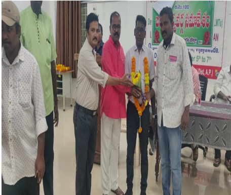
గుర్తించడం. తగిన పదవిని అందజేయడం జరుగుతుందని తెలిపారు.