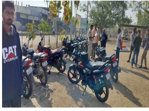
ఒక్కరూ తమ వాహనాలకు సంబంధించిన పేపర్లను రెడీ ఉంచుకొని మాత్రమే రోడ్డు పైకి రావాలని సూచించారు. ఈ తనిఖీ లో ట్రైని ఎస్పైలు పోలీసు సిబ్బంది పాల్గొన్నారు.