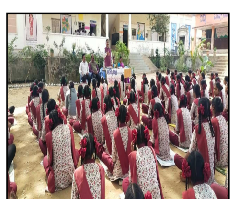
.వియో మాట్లాడుతూ విద్యార్థులు సమస్యలు వచ్చినపుడు 1098 కి ఫోన్ చేయాలని తెలిపారు.ఈ కార్యక్రమంలో ఉపాధ్యాయు నిబ్బంది,విద్యార్థులు పాల్గొన్నారు.