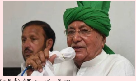
హర్యానా మాజీ ముఖ్యమంత్రి, ఇండియన్ నేషనల్ లోక్ దళ్ అధినేత (ఇఎన్ఎల్ డి) చీఫ్ ఓం ప్రకాష్ చౌతాలా విగతా 2లో

హర్యానా మాజీ సీఎం ఓం ప్రకాష్ చౌతాలా ఇకలేరు కార్మిక అరెస్టు తో కన్నుమూసిన చౌతాలా ఇండియన్ నేషనల్ లోక్ దళ్ అధినేత హర్యానాకు బదులార్థం సీఎంగా నివలంబించిన లీడర్