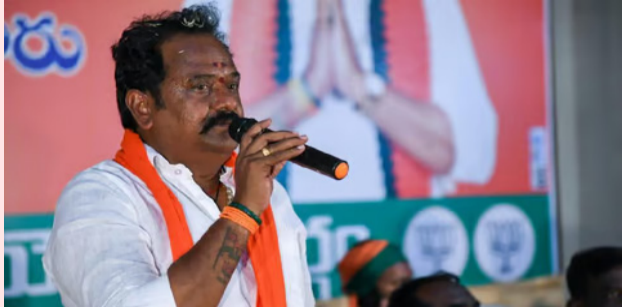
మాజీ మంత్రి, బీఆర్ఎస్ వర్కింగ్ ప్రెసిడెంట్ కేటీఆర్ పై కామారెడ్డి ఎమ్మెల్యే విగతా 2లో

ఈ కేసుతో బీజేపీకి ఏం సంబంధం మాజీ మంత్రి, బీఆర్ఎస్ వర్కింగ్ ప్రెసిడెంట్ కేటీఆర్ పై కామారెడ్డి ఎమ్మెల్యే కాటిపల్లి వేంకటరమణారెడ్డి సంచలన వ్యాఖ్యలు చేశారు. కేటీఆర్ తప్పు చేయకుంటే భయమెందుకు అని ప్రశ్నించారు. హైదరాబాద్: మాజీ మంత్రి, బీఆర్ఎస్ వర్కింగ్ ప్రెసిడెంట్ కేటీఆర్ పై కామారెడ్డి ఎమ్మెల్యే విగతా 2లో