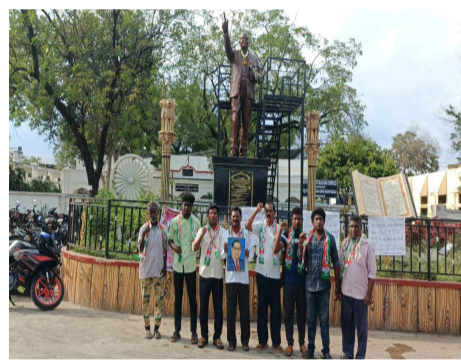
డా., బి.ఆర్ అంబేద్కర్ కి పార్లమెంటు ఎదుట బహిరంగంగా క్షమాపణ చెప్పాలి లేని యెడల కాంగ్రెస్ పార్టీ అధ్వర్యంలో దళితులు, బహుజనలు, మహాజనలు, రాష్ట్రంలో జిల్లాలో మందలాలో పెద్ద