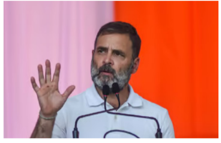
న్యూఢిల్లీ: అంటే డర్లపై అమిత్ షా చేసిన వివాదాస్పద వ్యాఖ్యల నుంచి ప్రజల దృష్టి మళ్లించడానికి జిజీవీ ప్రయత్నిస్తోంది.. పార్లమెంటులో చోటుచేసుకున్న ఘటనలు అందులో భాగమేనని కాంగ్రెస్ ఎంపీ, లోక్ సభలో విపక్ష నేత రాహుల్ గాంధీ ఆరోపించారు. ఢిల్లీలోని కాంగ్రెస్ విగతా 2లో

ఖర్గేను, నన్ను తోసేశారు లోక్ సభలో విపక్ష నేత రాహుల్ ఆగ్రహం జిజీవీ ఎంపీలు కర్రలు చేతబట్టి సభలోకి వెళ్లకుండా మమ్మల్ని అడ్డుకున్నారు అంటే డర్లపై అమిత్ షా వ్యాఖ్యల నుంచి ప్రజల దృష్టి మళ్లించేందుకు జిజీవీ యత్నం జిజీవీ, ఆరెస్సెస్ ఆలోచనాసరళి ఎప్పుడూ రాజ్యాంగానికి, అంటే డర్లకు వ్యతిరేకం పా క్రమావళి, రాజనామాకు డిమాండ్ నన్ను నెట్టారు.. బ్యాలెన్స్ తప్పి కిందపడ్డా రాజ్యసభలో విపక్ష నేత మల్లికార్జున ఖర్గే దేశవ్యాప్త ఉద్యమం చేస్తామని హెచ్చరిక విగతా 2లో