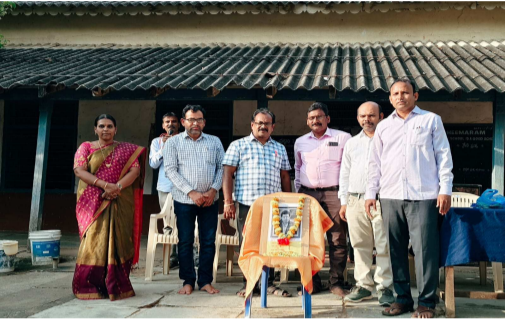
జనసముద్రం న్యూస్ భీమారం: భీమారం జిల్లా పరిషత్ ఉన్నత పాఠశాలలో డిసెంబర్ 20 గణితదినోత్సవపురస్కరించుకొని వేడుకలు నిర్వహించారు

విద్యార్థులకు వ్యాసరచన క్షీకే రంగోలి గణిత ప్రతిభ పరీక్షలు నిర్వహించారు పోటీలలో గెలుపొందిన విద్యార్థులకు బహుమతులు అందజేశారు ఉపాధ్యాయులు మాట్లాడుతూ విద్యార్థుల్లో గణితం పట్ల ఆసక్తిని పెంపొందించడానికి ఇలాంటి కార్యక్రమాలు తోడ్పడుతాయి అని తెలిపారు గణిత శాస్త్రంలో శ్రీనివాస రామానుజన్ చేసిన అపారమైన కృషిని ఉపాధ్యాయులు కొనియాడారు