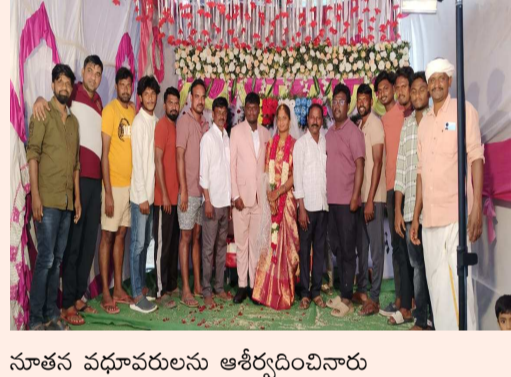
నూతన వధూవరలను ఆశీర్వాదించినారు