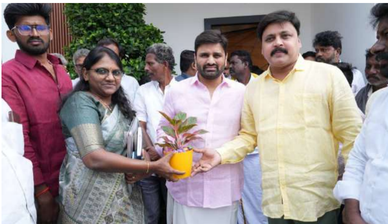
మున్సిపాలిటీలో అభివృద్ధి పనులకు రూ.42 కోట్లు, కొయ్యలగూడెం నగర పంచాయతీలో భూగర్భ మురుగునీటి పారుదల వ్యవస్థ నిర్మాణానికి అవసరమైన నిధులు మంజూరు చేయాలని ప్రభుత్వానికి ప్రతిపాదనలు పంపినట్లు ఎంపీ మహాద్ కుమార్ తెలిపారు. రానున్న బడ్జెట్ నిధులు కేటాయించాలని ప్రభుత్వాన్ని కోరినట్లు ఎంపీ స్పష్టం చేశారు.

ఏలూరు, జనవరి 17: మున్సిపాలిటీలో అభివృద్ధి పనులు చేపట్టేందుకు అవసరమైన నిధుల మంజూరుకు తన వంతు కృషి చేస్తానని ఎంపీ పుట్టా మహాద్ కుమార్ తెలిపారు. ఏలూరు క్యాంపు కార్యాలయంలో చింతలపూడి ఎమ్మెల్యే సాంగా రోషన్ కుమార్ తో కలిసి చింతలపూడి, జంగారెడ్డిగూడెం మున్సిపల్ కమిషనరీలో ఎంపీ మహాద్ కుమార్ శుక్రవారం సమీక్ష సమావేశం నిర్వహించారు. చింతలపూడి, జంగారెడ్డిగూడెం మున్సిపాలిటీలో చేపట్టాల్సిన అభివృద్ధి పనులను ఎమ్మెల్యే సాంగా రోషన్ కుమార్ ఎంపీ మహాద్ కుమార్ దృష్టికి తీసుకువచ్చారు. రూ.12 కోట్ల ఆదాయం కలిగిన జంగారెడ్డిగూడెం మున్సిపాలిటీని గ్రేడ్ -2 నుంచి గ్రేడ్ -1 గా వర్గొన్నది కల్పించాలని పంపిన నివేదిక ప్రస్తుతం ప్రభుత్వ పరిశీలనలో ఉందని కమిషనర్ కె.వి రమణ ఎంపీ మహాద్ కుమార్ కు వివరించారు. అనంతరం ఎంపీ మహాద్ కుమార్ మాట్లాడుతూ మున్సిపాలిటీలో మౌలిక వసతులు కల్పించుటకు ఎమ్మెల్యే రోషన్ కుమార్ తో కలిసి కేంద్ర, రాష్ట్ర ప్రభుత్వాల నుంచి సాధ్యమైనంత ఎక్కువ నిధులు రాబట్టేందుకు కృషి చేస్తున్నట్లు ఎంపీ పేర్కొన్నారు. జంగారెడ్డిగూడెం మున్సిపాలిటీలో భూగర్భ మురుగునీటి పారుదల వ్యవస్థ నిర్మాణానికి రూ. 80 కోట్లతో, సెంట్రల్ లైటింగ్, పారుదల అభివృద్ధి, ఇతరత్రా పనులు చేపట్టేందుకు రూ.50 కోట్లు, చింతలపూడి