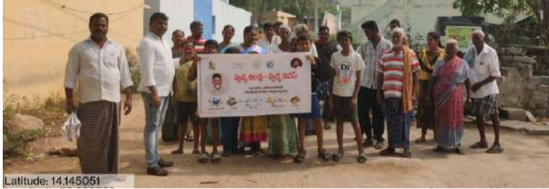
కాకులవరం గ్రామంలో "స్వచ్ఛ ఆంధ్ర స్వచ్ఛ దివస్" కార్యక్రమం