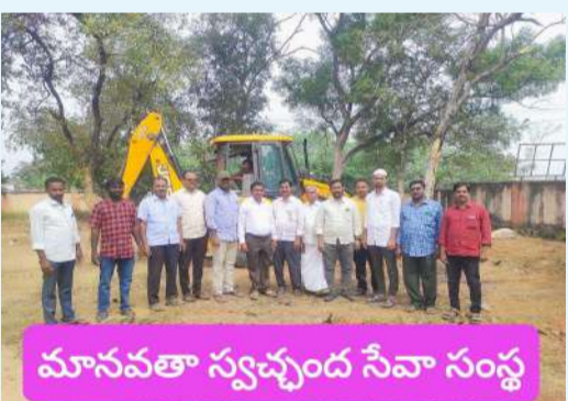
మానవతా స్వచ్ఛంద సేవా సంస్థ

లక్ష్మిరెడ్డిపల్లి జనసముద్రం న్యూస్ జనవరి 18 లక్ష్మిరెడ్డిపల్లి మానవతా స్వచ్ఛంద సేవా సంస్థ ఆధ్వర్యంలో