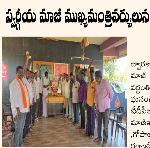
పాకనాటి శ్రీమన్నారాయణ, పెనుమాల రాములు గ్రామ కూలమి నాయకులు పాల్గొన్నారు