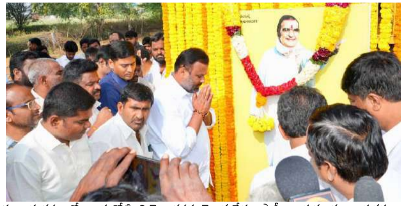
ఈ కార్యక్రమంలో రాయచోటి నియోజకవర్గం తెలుగుదేశం పార్టీ నాయకులు, కార్యకర్తలు, తదితరులు పాల్గొన్నారు.