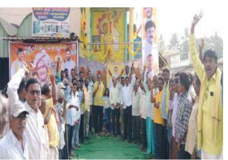
జీవితాలు మార్చేందుకు వచ్చిన అవకాశం నిరూపించిన మహనీయులు ఎన్టీఆర్. ఎన్టీఆర్ ఆశించిన సమ సమాజాన్ని సాధించుకుందాం అని పిలుపు.