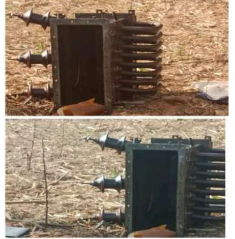
విషయం తెలుసుకున్న పోలీసు వాళ్ళు, విద్యుత్ శాఖ వాళ్ళు వెంటనే

జనసముద్రం న్యూస్ జనవరి 27 మహబూబాద్ జిల్లా బయ్యారం మండలం అల్లి గూడెం గ్రామపంచాయతీలో కరెంటు ట్రాన్స్ఫార్మర్ దొంగలించిన దొంగల ముఠా సుమారుగా లక్ష రూపాయలు అన్ని నష్టం చేసిన దొంగల ముఠా బయ్యారం మండలం అల్లిగూడెం పంచాయతీలోని భీమ్మాతండా వాసులు అర్ధరాత్రి అందరూ ఘోర నిద్రలో ఉండగా దొంగలు తమ చేతి వాటం ప్రదర్శించి ఊరికి ఆసుకోని వారం పది రోజుల క్రితం కొత్త ట్రాన్స్ఫార్మర్ నలుగురు రైతులు కలిసి తలో 30 వేలతో డిడి తీసి 2 లక్షల ఖరీదైన ట్రాన్స్ఫార్మర్ పెట్టి ఓపెనింగ్ కూడా చేయలేదు, అప్పుడే దొంగతనానికి గురైంది! ట్రాన్స్ఫార్మర్ లోపల వైరింగ్ మొత్తం తీసుకోని కాబి డబ్బాని అక్కడ పడేసి వెళ్ళిపోయారు దొంగలు, ఇంకా వాళ్ళకి కావాల్సిన వాటిని తీసుకోని వెళ్ళడం జరిగింది.