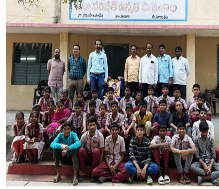
ప్రజలకు సేవ చేయడానికి తన బ్రతుకును తన భర్త తో కలిసి త్యాగం చేసినటువంటి గొప్ప మానవతావాది అని కొనియాడినారు.