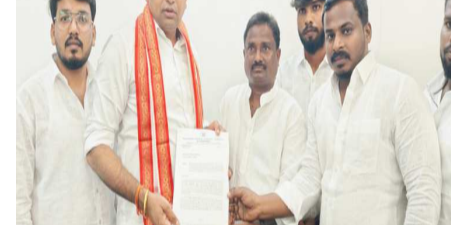
కార్పొరేషన్ గా నామకరణం చేసి లిడ్ క్యాబ్ పేరును తొలగించారు తెలంగాణ లెదర్ కార్పొరేషన్ బోర్డు మెంబర్లు గాని లెదర్ కార్పొరేషన్ నుంచి తయారుచేసిన లెదర్ వస్తువులు మాదిగ కమ్మూనిటీకి సంబంధం లేని వ్యక్తులు డిఆర్ఎస్ ప్రభుత్వంలో సామ్మ్యు చేసుకున్నారు అందువల్ల కాంగ్రెస్ పార్టీ అధికారంలోకి వచ్చిన తర్వాత

ముఖ్యమంత్రి ఎనుముల రేవంత్ రెడ్డి మాదిగల ఏబిసిడి వర్గీకరణ ఏర్పాటు చేయాలని అసెంబ్లీ ఏకగ్రీవ తీర్మానం తీర్మానం చేసిన మొదటి వ్యక్తి తెలంగాణ ముఖ్యమంత్రి అదేవిధంగా సుప్రీంకోర్టు గైడ్లన్స్ ప్రకారం సాధ్యమైనంత త్వరలో ఏబిసిడి వర్గీకరణ జరగాలని వన్ మెన్ కమిషన్ కూడా ఇవ్వడం జరిగింది నాలుగు తారీకు జరగబోయే క్యాబినెట్ లో కూడా వర్గీకరణ అంశం చర్చకు వచ్చే అవకాశం ఉంది అందులో భాగంగా మాదిగ లెదర్ కార్పొరేషన్ బైలాస్ మార్చుటకు ముఖ్యమంత్రి దృష్టికి తీసుకెళ్లాలని ఎంపీ గారు హామీ ఇవ్వడం జరిగింది ఈ సందర్భంగా దళిత ఇండస్ట్రీ అసోసియేషన్ ఎగ్జిక్యూటివ్ మెంబర్స్ చేయడం మహేందర్ చెడ అంబేద్కర్ బొట్ల శ్రీనివాస్ ఎంపీ గారికి కృతజ్ఞతలు తెలియజేయడం జరిగింది.