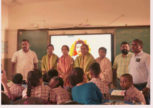
జనసముద్రం న్యూస్ జమ్మికుంట (టౌన్) ప్రతినిధి: 3 జనవరి కరీంనగర్ జిల్లాలోని మైలారం పాఠశాలలో చదువులతల్లి, భారత దేశపు మొట్టమొదటి మహిళా