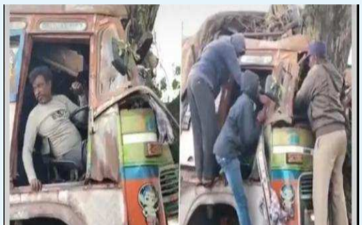
(జనసముద్రం న్యూస్ కరీనగర్ ప్రతినిధి// జనవరి 8 చుజూరాబాద్) చుజూరాబాద్ మండలంలోని సింగపూర్ మాండ్రాది పల్లె వద్ద లారీ అదుపుతప్పి చెట్టును ఢీకొంది. ఈ సంఘటనలో