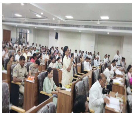
చేయాలని, మరియు బస్టి దవాఖానలో చికిత్స చేసే పరికరాలు ఏర్పాటు చేయాలని కోరుతూ రైల్వే వంతెన నిర్మాణంలో ఇండ్లు కోల్పోయిన వారికి త్వరగా సప్లయ పరిహారం అందించి వంతెన పనులు పూర్తి చేయాలని, అదేవిధంగా జిల్లా బస్సుల రాకపోకలకు దారి ఏర్పాటు చేయాలని కోరారు. ఈ