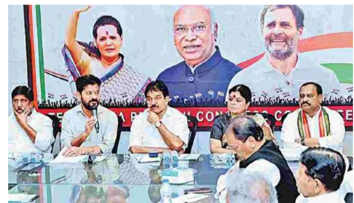
(మిగతా 2వ పేజీలో)