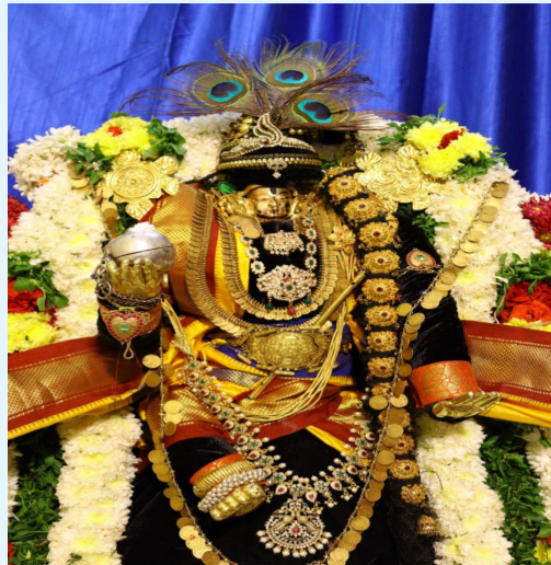
నిర్వహిస్తున్న ఈ కార్యక్రమాలలో భక్తులు అధిక సంఖ్యలో పాల్గొని శ్రీ సీతారామచంద్ర స్వామి వారి శుభాశీస్సులు పొందాలని అధికారులు విజ్ఞప్తి చేశారు.

జనసముద్రం జనవరి 8 బ్యూరో : పనుడేవ సుతం దేవం కంస చాణూర మర్తనం దేవకీ పరమానందం కృష్ణం వందే జగద్గురుం. భద్రాచలం దివ్య క్షేత్రంలో జరుగుతున్న వైకుంఠ ఏకాదశి ఉత్సవాలలో భాగంగా బుధవారం సీతారామచంద్రస్వామి వారు శ్రీకృష్ణ పరమాత్మగా భక్తులకు దర్శనం ఇచ్చారు. శ్రీకృష్ణ అవతారంలో దర్శనం ఇచ్చిన శ్రీ సీతారామచంద్ర స్వామివారి దర్శించుకున్న భక్తులు హారే రామ హారే రామ రామ రామ హారే హారే హారే కృష్ణ హారే కృష్ణ కృష్ణ కృష్ణ హారే హారే అంటూ స్వామివారిని ప్రార్థిస్తూ ఉభయతెలుగు రాష్ట్రాలలో ఆయురారోగ్య ఐశ్వర్యాలతో పుభయ తెలుగురాష్ట్ర ప్రజలు అభివృద్ధి చెందాలని శ్రీకృష్ణ పరమాత్మను వేడుకొన్నారు. భద్రాచలంలో గురువారం పవిత్ర గోదావరి నది తీరాన హంస వాహనంలో స్వామివారికి పోషణ అనంతరం ముక్కోటి ఏకాదశి శుభవారం ఉదయం వైకుంఠ ద్వార దర్శనం జరుగుతాయని, జిల్లా అధికారులు క్రమశిక్షణతో