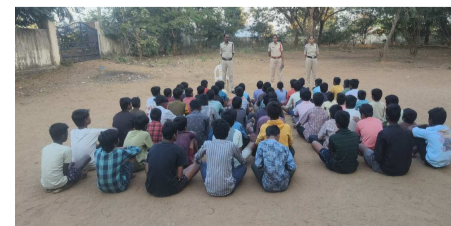
ఈ కార్యక్రమంలో పోలీస్ సిబ్బంది పాల్గొన్నారు