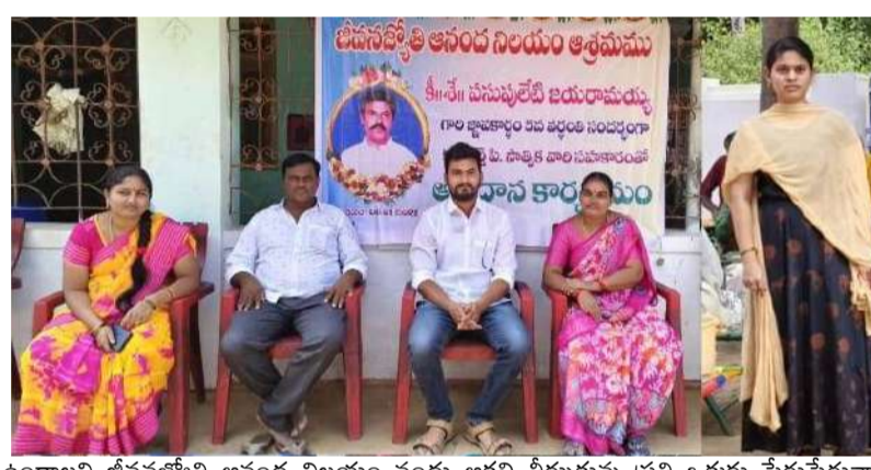
ఉండాలని జీవనజ్యోతి ఆనంద నిలయం నందు ఆకలి తీర్చుకున్న ప్రతి ఒక్కరు పేరుపేరునా ముక్కోటి దేవతల ద్వారా తెలిపారు ఇలాగే దయదాతృ వ్యూహంతో శుభకార్యాలకు అన్నదానం జరిపించడలచిన వారు క్రింది ఖోసీ నెంబర్లను ఒక వారం రోజులు ముందుగా సంప్రదించాలని జీవనజ్యోతి ఆనందనిలయ బృందం ఒక ప్రత్యేక ప్రకటనలో తెలిపారు సంప్రదించవలసిన మొబైల్ నెంబర్స్ 9030068619, 8501005384, 8096480915, 8688069374 ,9703105755,9440883354,7893603901,