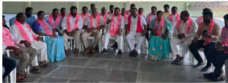
లో వారు తెలంగాణకు ఇప్పుడున్న ప్రభుత్వంలో అన్ని విధాలా వెనకబడ్డ అభివృద్ధి విషయంలో కానీ ఏ విధంగా చూసినా గత టిఆర్ఎస్ గవర్నమెంట్ ప్రభుత్వమే పనిచేసింది అని చెప్పుకొచ్చారు ఇకనుండి పార్టీ పునర్ వైభవానికి సాయి శక్తుల పార్టీ కార్యకర్తలు యువకులు పనిచేయాలని వారు సూచించారు మరియు యువతకు మహిళలకు పెద్దపీట బిఆర్ఎస్ లో అవకాశముంటుందని కెసిఆర్ చెప్పారు పార్టీ సిల్వర్ జూబ్లీ ఉత్సవాలు పెద్ద ఎత్తున జరపాలని వారు అందరికీ దిశ నిర్దేశం చేయడం జరిగింది రేవంత్ రెడ్డి ముఖ్యమంత్రి పచ్చినప్పటి నుంచి బదుగు బలహీన వర్గాలకు అన్యాయం జరుగుతుంది కెసిఆర్ ప్రభుత్వంలో బదుగు బలహీన వర్గాలకు మరియు కులవృత్తులకు తగిన ప్రోత్సాహం లభించేది బలహీనవర్గాలను బలహీనపరిస్తే ప్రభుత్వాల కులదం ఖాయం