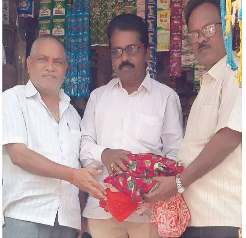
వివరించినారు. ఇలా మానవ సేవే మాధవ సేవగా భావించి ప్రతి ఒక్కరు ఏదో విధంగా సాటి మనషికి సహాయపడి భగవంతు ని కృపకు పాత్రలు కాగలరని ఆయన అన్నారు.