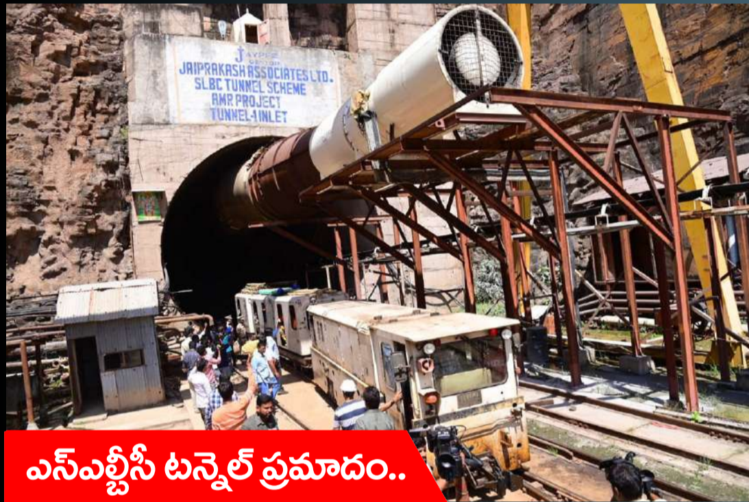
ఎస్ఎల్టీసీ టన్నెల్ ప్రమాదం..