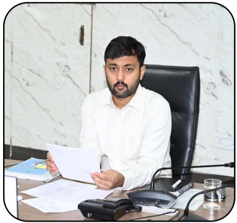
మహబూబాబాద్ జిల్లా ప్రతినిధి జనసముద్రం న్యూస్ ఫిబ్రవరి 25