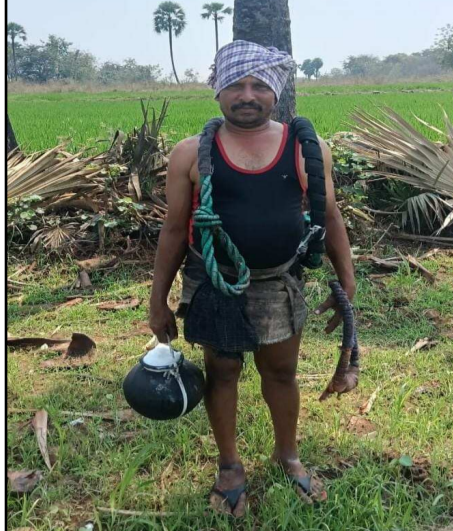
మహాబూబాబాద్ జిల్లా ప్రతినిధి జన సముద్రం న్యూస్ ఫిబ్రవరి 25 మహాబూబాబాద్ జిల్లాలో తాటి చెట్లను నరికివేత అపండి తాటికల్లు పరిరక్షణకు ప్రత్యేక చర్యలు తీసుకోండి