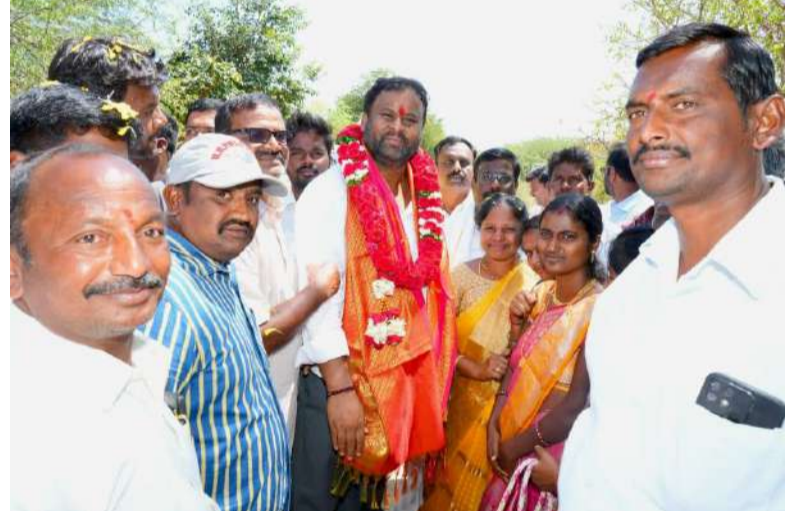
అన్నదానం గొప్ప పుణ్య కార్యం