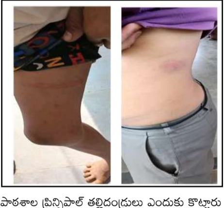
పాఠశాల ప్రిన్సిపాల్ తల్లిదండ్రులు ఎందుకు కొట్టారు