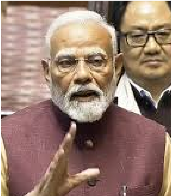
చేసినా.. నాటి కాంగ్రెస్ ప్రభుత్వాలు అంగీకరించలేదని ప్రధాని గుర్తు చేశారు. కానీ, తాము ఓబీసీ కమిషన్ ను ఏర్పాటు చేయటమేగాక రాజ్యాంగబద్ధతను

తెలిపే తీర్మానంపై జరిగిన చర్చకు బదులిస్తూ మోదీ గురువారం రాజ్యసభలో ప్రసంగించారు. ఈ సందర్భంగా ప్రధాన ప్రతిపక్షం కాంగ్రెస్ పై విమర్శలు కురిపించారు. 'దేశానికి స్వాతంత్ర్యం వచ్చిన తర్వాత ఆరు దశాబ్దాలపాటు కాంగ్రెస్ పాలనలో బుజ్జగింపు విధానాలే నడిచాయి. కొందరికి మాత్రమే ఇవ్వటం.. మిగిలినవారికి నిరాకరించటం అనే విధంగా పాలన నడిచింది. 2014 తర్వాత ఈ పద్ధతి మారింది. బుజ్జగింపు విధానాల మీద కాకుండా.. అందరి సంతృప్తి లక్ష్యంగా పాలన మొదలైంది. వనరులను సమర్థంగా ఉపయోగించుకోవటం, ఏ ఒక్కరినీ వదిలిపెట్టకుండా అందరికీ పథకాలను చేరువ చేయటంపైనే దృష్టి పెట్టాం. ఈ విధంగా ప్రతి స్థాయిలో సబ్ కా సాత్.. సబ్ కా వికాస్ విధానాన్ని అమలుపరిచాం. దాని ఫలితాలు ప్రస్తుతం చూస్తున్నాం. 25 కోట్ల మందిని పేదరికం నుంచి బయటకు తెచ్చాం' అని మోదీ తెలిపారు.