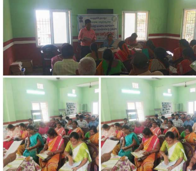
జరిగినది.. మండలంలోని రైతు సేవా కేంద్రాలలో పని చేయనున్న గ్రామ వ్యవసాయ సహాయులు, గ్రామ ఉద్యాన సహాయులు, రైతులు పాల్గొనడం జరిగినది..