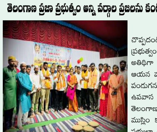
అద్దం పడుతోందన్నారు. తెలంగాణ ప్రజా ప్రభుత్వం అన్ని వర్గాల ప్రజలను కంటికి రెప్పలా కాపాడు కుంటుందన్నారు. కార్యక్రమంలో మండల తహసీల్దార్, మున్సిం మత పెద్దలు, కాంగ్రెస్ నాయకులు, ప్రజా ప్రతినిధులు తదితరులు పాల్గొన్నారు.