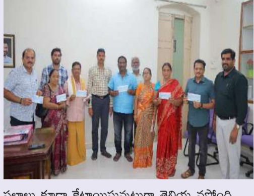
వ్వలాలు కూడా కేటాయిస్తున్నట్లుగా తెలియ వస్తోంది.

జనసముద్రం మార్చి 28 బ్యూరో లీఫ్ టెంపుల్ టౌన్ భద్రాచలం. దివ్యక్షేత్రం భద్రాచలం రామాలయం లభ్యవృద్ధిలో భాగంగా రామాలయం సమీపంలో ఉన్న ఇండ్ల యజమానులు తమ ఇండ్లను కోల్పోవడం జరుగుతుంది. దీనిలో భాగంగా గృహ యజమానుల కోర్కె మేరకు ప్రభుత్వం అందిస్తున్న గృహ నిర్మాణతులకు అధిక మొత్తంలో సొమ్ములు చెల్లినా ఆ సొమ్ములు చెక్కుల రూపంలో గృహనిర్మాణతులకు భద్రాచలం ఆర్డీవో ద్వారా గృహ నిర్మాణతులకు అందజేయడం జరిగింది. గృహాలు కోల్పోయిన వారికి సొమ్ములతోపాటు ఇండ్ల