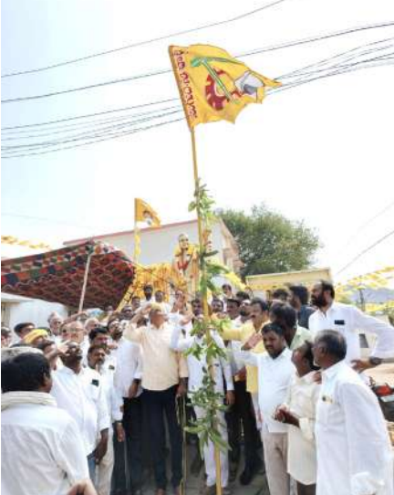
ఆశయాల ప్రతి కార్యకర్తకు మార్గదర్శకమని, ప్రజాసేవలో ముందుండటం ద్వారానే పార్టీ మరింత బలోపేతం అవుతుందని తెలిపారు. లి