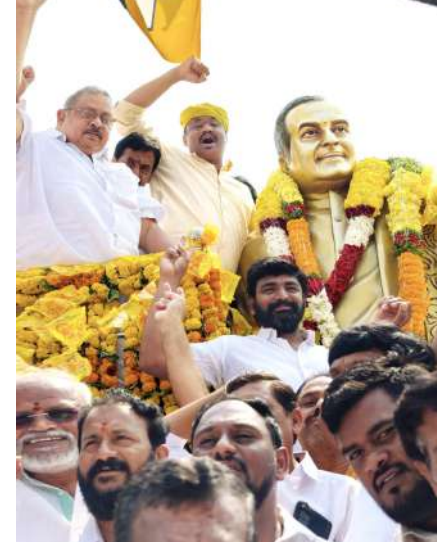
ఈ కార్యక్రమంలో తెలుగుదేశం నాయకులు కార్యకర్తలు, ప్రజలు పాల్గొన్నారు