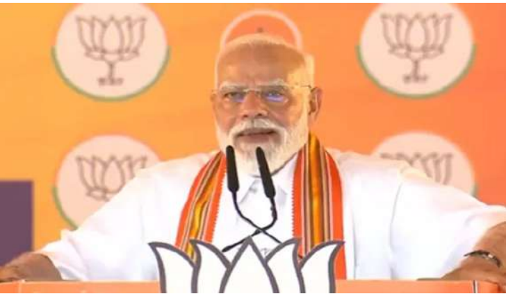
అసెంబ్లీ ఎన్నికల సందర్భంగా పాలక్కడ్లో విరూపాక్షుని ప్రధాని మోదీ పేర్కొన్నారు. రాష్ట్రంలో భిన్నమైన వాతావరణం ఉందని, మార్పు సందేశం స్పష్టంగా కనిపిస్తోందన్నారు.