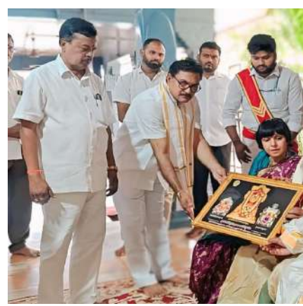
అశీర్వాదాలు, స్వామివారి ప్రసాదాలను శేష వ్రాస్తూనే సమర్పించారు. ఈవే యర్రం శెట్టి