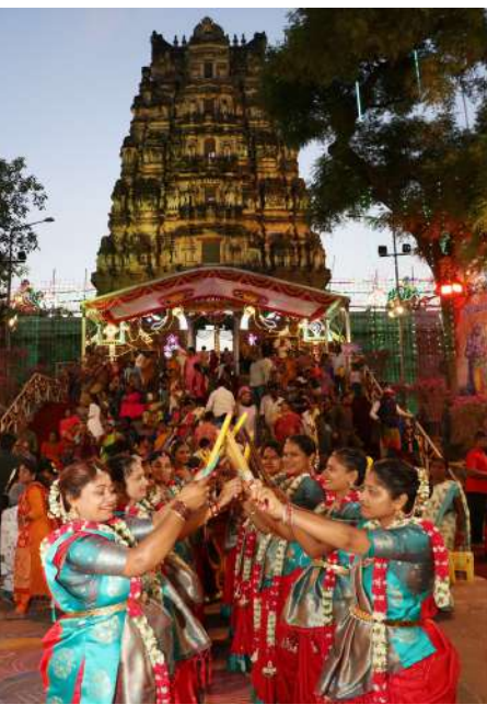
ఓంటిమిట్ట, జనసముద్రం న్యూస్, ఏప్రిల్ 3:

రెండో అయోధ్యగా విరాజిల్లుతున్న ఓంటిమిట్ట శ్రీ కోదండరామస్వామి బ్రహ్మాత్మవాల్లో శుక్రవారం రాత్రి అశ్వవాహనంపై స్వామివారు కటాక్షించారు. రాత్రి 7 గంటలకు స్వామివారి వాహన సేవ ప్రారంభమైంది. వాహనసేవ ముందు భక్తజన భృందాలు చెక్కబజనలు, కోలాటాలతో స్వామివారిని కీర్తిస్తుండగా, మంగళవాయిద్యాల నడుమ కోలాహలంగా