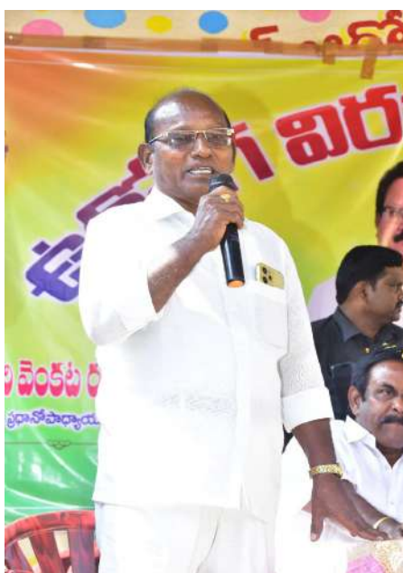
కేంద్ర ప్రభుత్వంలో ఉన్న అన్ని పార్టీలు మద్దతు తెలపడం, జీర్ణింపకోలేక జగన్ ఇలా మాట్లాడుతున్నారని అన్నారు. రాజధానిలేని రాష్ట్రానికి, దిక్కువీల నిలిచి, రైతులందరినీ