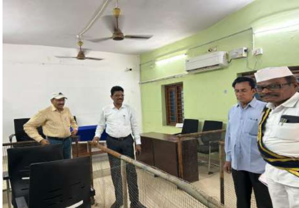
మున్సిపల్ సాధారణ ఎన్నికల నేపథ్యంలో ఈ నెల 4వ తేదీన మంచుర్యాల జిల్లాలోని క్యాతన్ పల్లి మున్సిపాలిటీలో చైర్ పర్సన్, వైస్ చైర్ పర్సన్ ల పరీక్ష ఎన్నికలు నిర్వహించనున్న నేపథ్యంలో పూర్తి స్థాయి ఏర్పాట్లు చేయడం జరుగుతుందని మంచుర్యాల జిల్లా అదనపు కలెక్టర్ (స్థానిక సంస్థలు) పి. చంద్రయ్య అన్నారు. శుక్రవారం బెల్లంపల్లి సబ్ కలెక్టర్, ఎన్నికల పరిశీలకులు మసోజ్ తో కలిసి క్యాతన్ పల్లి మున్సిపాలిటీ కార్యాలయాన్ని సందర్శించి బి-ఫామ్ జారీకి సంబంధించి ఫామ్-ఎ (అధికార ప్రతినిధి అధికరణ పత్రాలు)ను స్వీకరించారు. ఎన్నికల హాల్ను పరిశీలించి, బారికేడ్స్, భద్రతా ఏర్పాట్లు, నడుమాయాలను తనిఖీ చేసి ఎ.సి.పి. , ఎస్.ఐ. లతో భద్రతా ఏర్పాట్లను సమీక్షించారు. ఈ సందర్భంగా జిల్లా అదనపు కలెక్టర్ స్థానిక

•మంచుర్యాల జిల్లా అదనపు కలెక్టర్ (స్థానిక సంస్థలు) పి. చంద్రయ్య, జన సముద్రం న్యూస్ మంచుర్యాల జిల్లా ప్రతినిధి సిరిపురం మధుకర్ ఏప్రిల్ 3, 2026: