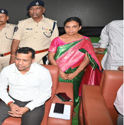
అంశాలపై చర్చించామని వివరించారు. నాలుగు జిల్లాలకు నాలుగు హైసీడ్ బోట్లు మంజూరు చేసినట్లు కలెక్టర్ తెలిపారు. తిరుపతి జిల్లాకు ఒకటి, నెల్లూరు జిల్లాకు రెండు, బాపట్ల జిల్లాకు ఒక బోటును మంజూరు చేయగా, ప్రకాశం జిల్లాకు కూడా బోటు మంజూరు చేసేలా ప్రతిపాదనలు పంపుతున్నామని చెప్పారు. ఈ బోట్లు 650 హెచ్ఐ సామర్థ్యంతో స్టీల్ బోట్లు కొనుగోలు చేయాలని మత్స్యకారులు ఎక్సగ్రాహంగా నిర్ణయించినట్లు తెలిపారు. ఈ బోట్లు కేవలం తీర గన్సీ కోసం మాత్రమే వినియోగిస్తామని, చేపల వేటకు ఉపయోగించబోమని మత్స్యకారులు స్పష్టం చేసినట్లు చెప్పారు. బోట్ల నిర్వహణ ఖర్చుపై అంచనా నిర్ణయం చేసే ప్రభుత్వానికి పంపుతామని తెలిపారు. తీర గన్సీ బలోపేతానికి పోలీసు, మెరైన్, మత్స్య, అటవీశాఖల సమన్వయంతో పాటు స్థానిక మత్స్యకారుల భాగస్వామ్యాన్ని కల్పిస్తామని కలెక్టర్ చెప్పారు. బోట్లను సంరక్షించుకోవడానికి బోట్ల కొనుగోలులో భాగస్వామ్యం చేసేందుకు పదిమంది మత్స్యకారుల పేర్లు ఇవ్వాలని సూచించినట్లు తెలిపారు. మెరైన్ పోలీసుల ఆధ్వర్యంలోని బోట్లలో తమ జిల్లాకు చెందిన మూడు బోట్లను రిపేర్లు చేయించేందుకు చర్యలు తీసుకుంటామని చెప్పారు.

సంప్రదించాలన్నా మత్స్యకారులు ఈ గ్రూపును వినియోగించుకోవచ్చని, లేదా నేరుగా తనను కలవచ్చని తెలిపారు. మత్స్యకారులకు సంబంధించి ప్రభుత్వం తరఫున ఈ నిర్ణయం తీసుకున్నా ఈ గ్రూపులో తెలియజేస్తామని, గ్రూపులోని సభ్యులందరూ మిగిలిన వారికి తెలియజేయాలని సూచించారు.