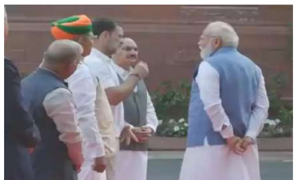
పార్లమెంట్ ప్రాంగణంలో శనివారం ఉదయం ఓ ఆసక్తికర సన్నివేశం చోటుచేసుకుంది. ఎప్పుడూ ఒకరిపై ఒకరు ఆరోపణలు చేసుకొనే ప్రధానమంత్రి మోదీ- కాంగ్రెస్ నాయకుడు రాహుల్ గాంధీతో కొద్దిసేపు ముచ్చటించారు. ఆ దృశ్యాలు సోషల్ మీడియాలో వైరల్ అవుతున్నాయి. జ్యోతిబా ఫులే 200వ జయంతి సందర్భంగా నివాళు లర్పించేందుకు రాష్ట్రపతి, ప్రధాని సహా పలువురు నాయకులు పార్లమెంట్ ప్రాంగణంలోని ప్రేరణా స్థలానికి వచ్చారు. పేజీ 2లో