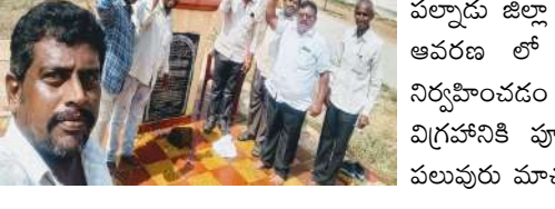
జనసముద్రంన్యూస్, మాచర్ల, ఏప్రిల్ 11:

పల్నాడు జిల్లా మాచర్ల పట్టణంలోని విద్యుత్ అధికారులు డివిజన్ ఆఫీస్ ఆవరణ లో జ్యోతిరావు పూలే జయంతి కార్యక్రమాన్ని ఘనంగా నిర్వహించడం జరిగింది. ఈ సందర్భంగా వారు జ్యోతి రావు పూలే చిత్రపటానికి పూలమాల వేసి నివాళులర్పించారు. ఈ కార్యక్రమంలో పలువురు మాచర్ల డివిజన్ విద్యుత్ అధికారులు పాల్గొన్నారు.