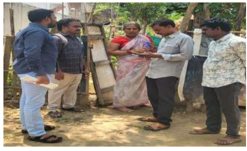
మార్కుగోదావరి/సీతానగరం/ ఏప్రిల్ 11/ జనసముద్రం న్యూస్ :

కేంద్ర, రాష్ట్ర ప్రభుత్వాల ఆదేశాల మేరకు మే 1 నుండి 31 వరకు జరగనున్న 'జనగణన 2027' ఫేస్-1 కార్యక్రమానికి సంబంధించి ఎన్యూఐటీఆర్, సూపర్వైజర్ల మూడు రోజుల శిక్షణ శనివారంతో