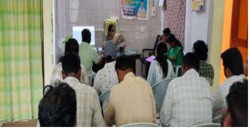
మార్కుగోదావరి/సీతానగరం/ ఏప్రిల్ 11/ జనసముద్రం న్యూస్ :