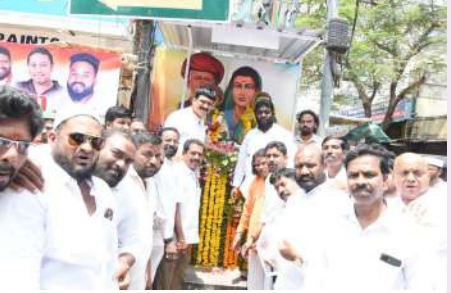
గౌతమ్ నగర్లో చలివేంద్ర క్యాంపు ప్రారంభం