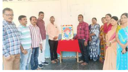
ఘనంగా మహాత్మా జ్యోతిరావు పూలే జయంతి వేడుకలు. ZPHS-జమ్మికుంట (BOYS)