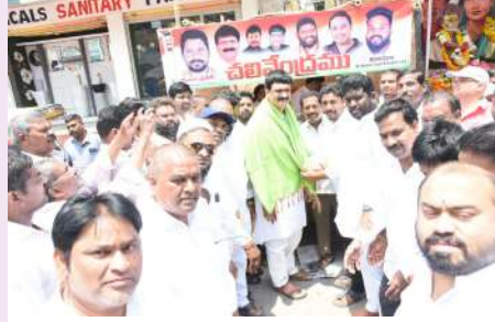
అనంతరం గౌతమ్ నగర్, ఉత్తమ్ నగర్, మల్కాజిగిరి నగర్ ప్రాంతాలలో ప్రజల కోసం చలివేంద్ర క్యాంపులను ప్రారంభించారు.