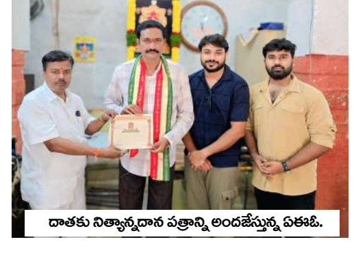
దాతకు నిత్యాన్నదాన పత్రాన్ని అందజేస్తున్న ఏఈవో.