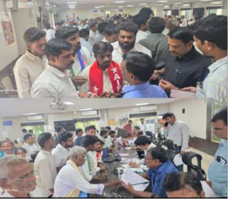
అనంతపురం కలెక్టర్ కి వినతిపత్రం ఇచ్చిన ఐక్య విద్యార్థి సంఘాల నాయకులు