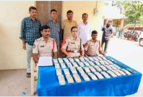
జనసముద్రం న్యూస్ ప్రతినధి ఎమ్మిగనూరు న్యూస్ ఏప్రిల్ 20 కర్నూలు జిల్లా సూపరింటెండెంట్ అఫ్ పోలీస్ వారి ఆదేశాల మేరకు ఎమ్మిగనూరు స్పెషల్ బ్రాంచ్ పోలీసులు వక్కా సమాచారంతో ఆన్లైన్ క్రికెట్ బెట్టింగ్ ముఠాను డి.ఎస్.పి భార్యవి ఆధ్వర్యంలో అరెస్టు చేసినట్లు డి.ఎస్.పి భార్యవి తెలిపారు. ఎమ్మిగనూరు పట్టణం, ఆదోని, సిరిగుప్ప (కర్ణాటక), పెద్ద తుంబలంకు చెందిన

నలుగురిని డి.ఎస్.పి భార్యవి అరెస్టు చేసి కేసు నమోదు చేసినట్లు తెలిపారు. నిందితులు నలుగురు ఒక ప్రత్యేక ఆన్లైన్ యాప్ ను ఏర్పాటు చేసుకొని ఐపీఎల్ క్రికెట్ మ్యాచ్ బెట్టింగ్ కు పాల్పడినట్లు విచారణలో తేలిందన్నారు. డి.ఎస్.పి భార్యవి నిందితులను అరెస్టు చేసి వారి వద్ద నుండి మొత్తం Rs.22,00,000/- (అక్షరాల ఇరవై రెండు లక్షల రూపాయలు) నగదు మరియు నేరము చేయుటకు ఉపయోగించిన (4) నాలుగు మొబైల్ ఫోన్లు సీజ్ చేసి కేసు నమోదు చేయడమైనది. ఇంకా ఇద్దరు నిందితులు పరారీలో ఉన్నట్లు డి.ఎస్.పి భార్యవి తెలిపారు. పరారీలో ఉన్న నిందితుల కోసం ముమ్మరంగా గాలిస్తున్నట్లు డి.ఎస్.పి భార్యవి తెలిపారు. ఇలాంటి చట్ట విరుద్ధమైన క్రికెట్ బెట్టింగ్ వంటి జూద కార్యకలాపాలు నిర్వహించే వారిపై కఠిన చర్యలు తీసుకోవాలని స్థానికులు కోరుతున్నారు.