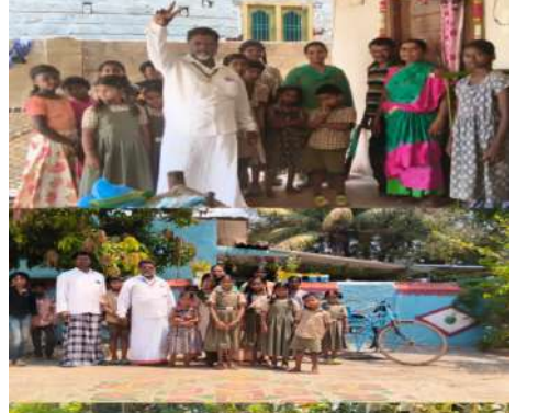
ఏప్రిల్ 20-21వన ప్రాంతాల్లో సర్వే మరియు గుర్తింపు.

ఆంధ్రప్రదేశ్ తిరుపతి జిల్లా రెడ్డె కోడూరు నియోజకవర్గం ఓ.బులవారిపల్లి మండలం పెద్దకరంపాడు గ్రామపంచాయతీ పాపిరెడ్డిపల్లి 02-హెచ్ డబ్ల్యు మన పిల్లల ఉజ్వల భవిష్యత్తు కోసం ఆంధ్రప్రదేశ్ ప్రభుత్వం బడి పిలుస్తోంది ప్రత్యేక కార్యక్రమాన్ని ప్రారంభించింది. నాణ్యమైన విద్య, ఆధునిక వసతులతో కూడిన ప్రభుత్వ పాఠశాలల్లో ఇప్పుడే మీ పిల్లల అడ్మిషన్లు ఖరారు చేసుకోండి! ముఖ్యమైన తేదీలు: అడ్మిషన్ ప్రక్రియ: ఏప్రిల్ 17 నుండి ఏప్రిల్ 23, 2026 వరకు. ఇన్చార్జ్ విశేషాలు: ఏప్రిల్ 18: సూర్య రౌలీ మరియు అసెంబ్లీ.