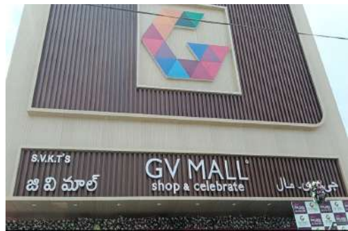
నరసాపురం ఏప్రిల్ 20

జనసముద్రం పశ్చిమగోదావరి జిల్లా ప్రతినిధి