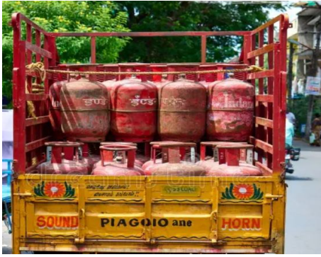
సాధారణంగా గ్యాస్ సిలిండర్ ఇంటికి వచ్చినప్పుడు మాత్రమే డెలివరీని ధృవీకరించడానికి ఓటీపీ

- గ్యాస్ వినియోగదారులారా జాగ్రత్త.. - మీ ఓటీపీ లడిగితే ఒకటికి రెండుసార్లు ఆలోచించండి!