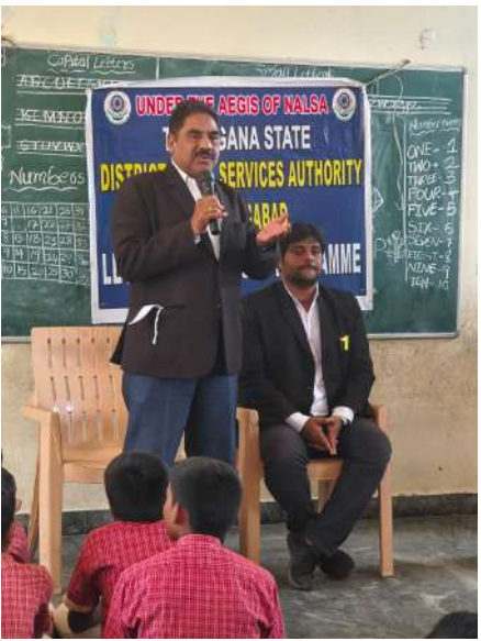
సాంకేతికత ఎంతటి ప్రయోజనకరమో, దాన్ని తప్పగా ఉపయోగిస్తే అంతటి ప్రమాదకరమని హెచ్చరించారు .