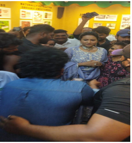
నేల్లూరు, ఏప్రిల్ 28, జనసముద్రం జిల్లా ప్రతినధి