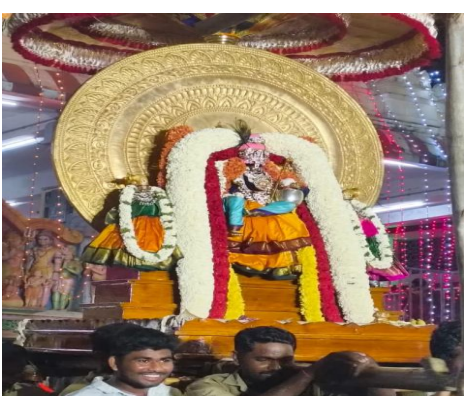
చంద్రప్రభ వాహనంపై శ్రీవారు

జనసముద్రం న్యూస్ ఏప్రిల్ 28 ఏలూరు జిల్లా, ద్వారకాతిరుమల ప్రతినధి. ప్రముఖ పుణ్యక్షేత్రమైన ద్వారకా తిరుమల శ్రీ వెంకటేశ్వర స్వామి వారి వైశాఖ మాస తిరు కళ్యాణ బ్రహ్మోత్సవాలు అత్యంత వైభవంగా కొనసాగుతున్నాయి. ఉత్సాహాల్లో భాగంగా మూడవ రోజైన మంగళవారం స్వామివారు భక్తులకు వివిధ అలంకారాల్లో, వాహనాలపై దర్శనమిచ్చి కనువిందు చేశారు. తెల్లవారుజామున స్వామివారు 'అపాల్య శాప విమోచన' అలంకారంలో భక్తులకు దర్శనమిచ్చారు. పురాణ గాథను స్మరింపజేసేలా సాగిన ఈ అలంకార సేవను దర్శించుకునేందుకు భక్తులు పెద్ద ఎత్తున తరలివచ్చారు.