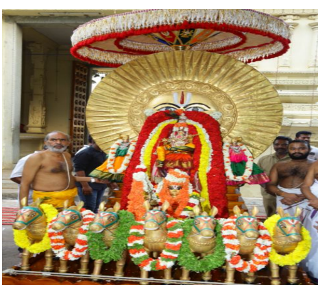
సూర్యప్రభ వాహనంపై స్వామివారు.