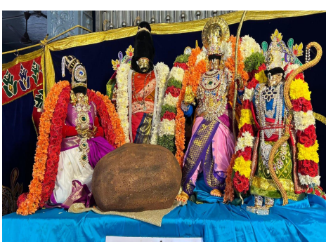
శ్రీ అపాల్య శాప విమోచన అలంకారంలో స్వామివారు.