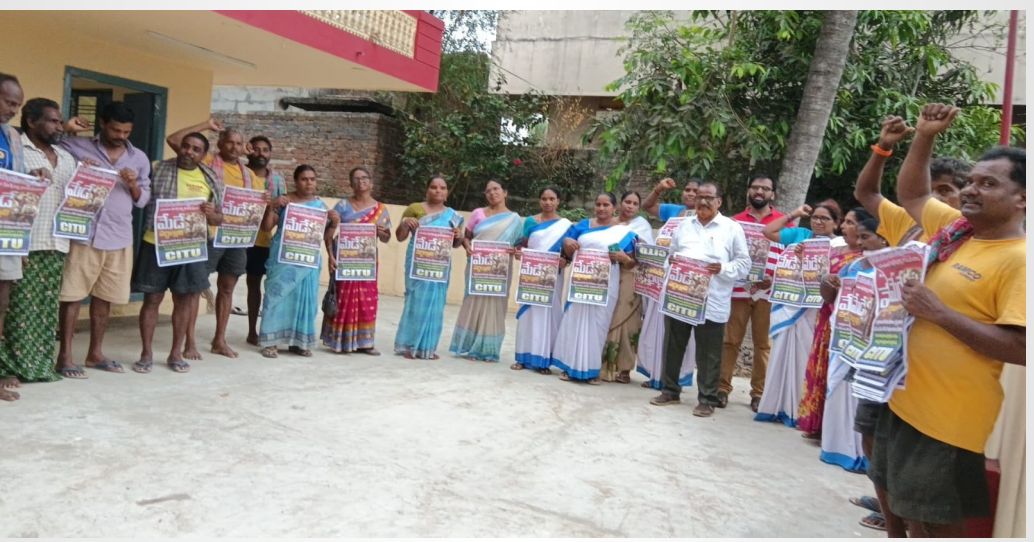
మొగల్తూరు ఏప్రిల్ 28 జనసముద్రం పశ్చిమగోదావరి జిల్లా ప్రతినధి