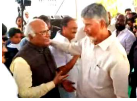
జనసముద్రం న్యూస్, మే. 01. గుడివాడ నియోజకవర్గం ప్రతినిధి.