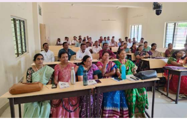
జనగణన శిక్షణ లో ఉపాధ్యాయులు