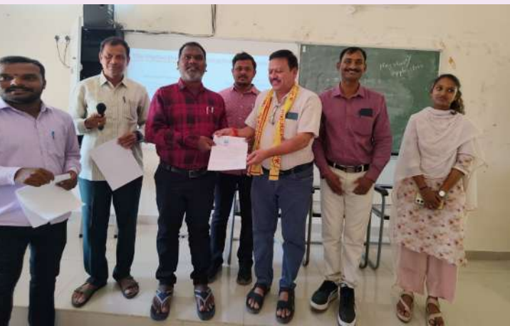
గుర్తింపు కార్డు లు అందజేస్తున్న జిల్లా అధికారి