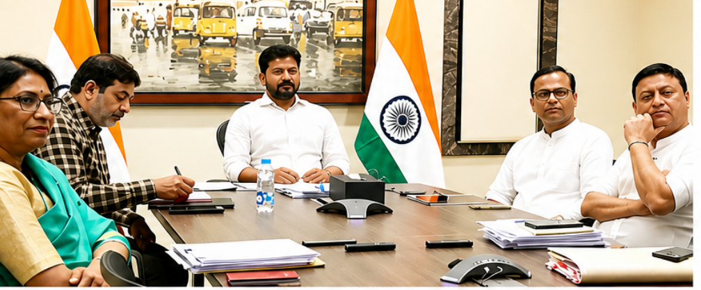
సమావేశంలో సీఎం రేవంత్ రెడ్డి, డిప్యూటీ సీఎం భట్టి విక్రమార్క, మంత్రి శ్రీధర్ బాబు, ఇతర అధికారులు

రఘురాం రాజన్ తో సీఎం భేటీ • సూచనలు, సలహాలు ఇవ్వాలని విజ్ఞప్తి ఏబిని సరైన విధానంలో వినియోగిస్తే అందరికీ మేలు: రఘురాం రాజన్