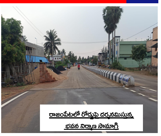
రాజంపేటలో రోడ్డుపై దర్జనమీసన్న భవన నిర్మాణ సామాగ్రి

తూర్పుగోదావరి/సీతానగరం/ మే 05/ జనసముద్రం న్యూస్ : సీతానగరం రాజమహేంద్రవరం మధ్య గల నాలుగు లైన్ల రహదారి ప్రమాదకరంగా మారింది. ఒక పక్క ఇసుకర్యాంపు నిర్వహణ కారణంగా రోడ్డుపై పేరుకుపోయిన ఇసుక ఓ పక్క మరోపక్క భవన నిర్మాణాల పేరిట ఇసుక, కంకర, ఇటుక గుట్టలతో ఉండడంతో జరగరాని ప్రమాదం ఏదైనా జరిగితే బాధ్యులు ఎవరు అని మండల ప్రజలు ప్రశ్నిస్తున్నారు. ఇటీవల కాలంలో జరిగిన రోడ్డు ప్రమాదాల్లో చాలామంది గాయాలు పలు కాగా, కొంతమంది మరణించారు. ఈ సందర్భంలోనే మండల యంత్రాంగం అప్రమత్తమై రోడ్డుపైన వరి ధాన్యం ఆరబోతలు ఆపాలని నిర్దేశించడం జరిగింది. దానితోపాటు రోడ్డుపైన ఘంట్లన్న, భవన నిర్మాణ సామాగ్రిని ఉంచరాదని, అలా ఉన్న ఎడల వాటిని జప్తు చేయడం జరుగుతుందని అధికారులు తెలిపిన వాటిని ఆచరణలో చూపించడంలో విఫలమయ్యారు. జిల్లా యంత్రాంగం సైతం రోడ్డుపై ఉన్న ఇసుకను తొలగించమని ఆదేశించిన దాని ఆచరణలో తీసుకురావడం సీతానగరం మండలంలో జరగలేదు. ప్రధానంగా ముగ్గుళ్ళు, ఇసుగుంటివారిపేట,